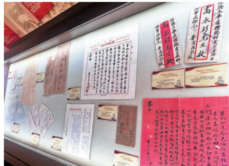
◆一封封僑批體現了海外僑胞愛國愛鄉的赤子情懷。