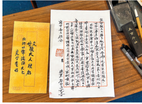
◆觀眾可現場體驗僑批的格式和寫法。