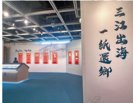
◆觀眾在現場細讀僑批歷史。