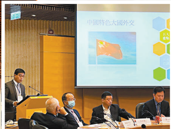
▲全球潮人與「一帶一路」學術政策國際論壇在香港中文大學舉行。