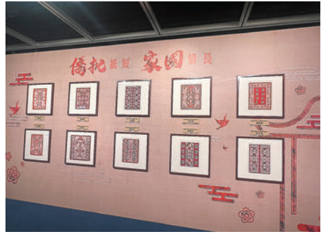
◆現場同步展出潮汕剪紙等精湛手工藝品。