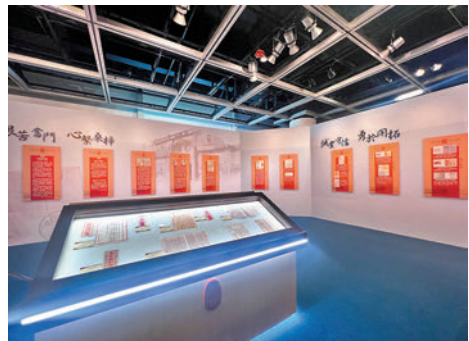
◆現場展出數百件展品與僑批歷史。