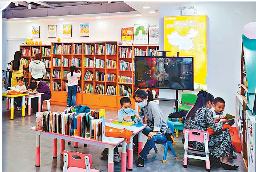
◆家長帶孩子到繪本館選書。