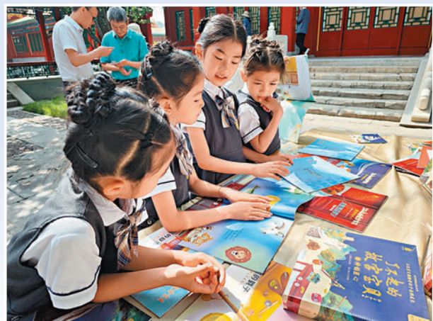
◆黃城根小學分校的小朋友在閱讀《了不起的故宮寶貝之神韻匠心》繪本。