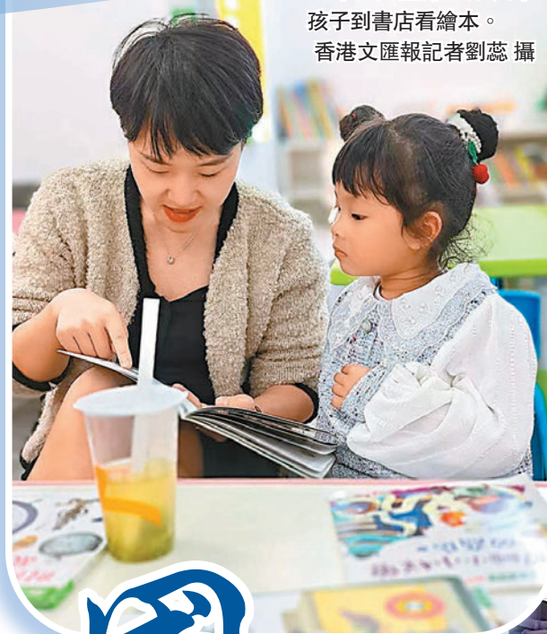
◆昨日兒童節，家長帶孩子到書店看繪本。

他的《鯉魚拐彎兒》把在黃河兩岸的所聞所見所記所思畫了下來；他的《鄉土和孩子》系列兒童詩集也都是自己在故鄉的所見所聞。馮傑說，從最初寫作他就一直沒有走出本土範圍。筆下的題材芝麻綠豆、雞飛狗跳，不能洗掉那些泥氣、腥氣、土氣、俗氣、煙火氣。「寫童詩就是在紙上做一次返回童年的『童旅』。」馮傑說，童年時代的草木情懷，自然感受，會無形地滋潤在一個人骨子深處，像青銅的浸透，像玉石的包漿，像鐘乳石靜靜滴垂，總會形成大小不等的「文化胎記」，讓人一生攜帶。