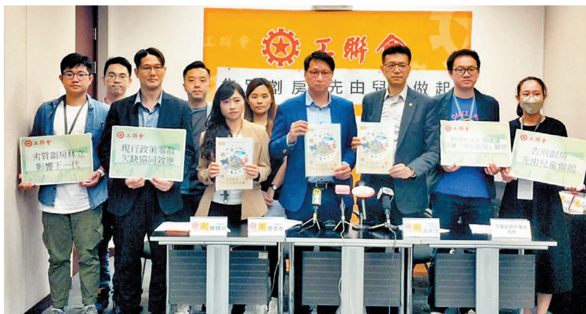
◆工聯會舉行記者招待，倡有兒童家庭劊房優先上樓。

工聯會在「告別劊房先由兒童做起」的研究報告中提出短中長期建議，包括於今年內成立劊房監督辦事處和組織巡查隊，參照現行的消防、屋宇等條例，再加上通風採光、消防安全、結構安全、環境衛生等指標，定義「劣質劊房」，發現違規即時檢控及要求清拆；在3年內，即2025年「簡約公屋」開始落成入伙之時，政府就能完成全港巡查和優先取締劣質劊房。