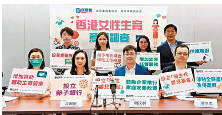
◆民建聯公布香港女性生育意願調查。

為了解本港女性的生育意願，民建聯早前以網上問卷訪問471名18歲以上香港女性，調查結果顯示，近四分之一人考慮或未知是否生育，其中逾三分之一有較高