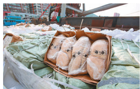
◆海關在柴灣起卸區檢獲40噸懷疑走私凍肉。

北角半山及天后廟一帶一向是野豬出沒的黑點，曾有居民被撞傷。2021年11月9日，就有警員被野豬撞傷。當晚8時16分，警員接報在後廟道發現野豬影蹤，一名男警在圍捕時被野豬撞及咬傷右小腿、左邊臀部及左右腰部，其後野豬逃走，疑慌不擇路由天后廟道26號至32號飛龍台2樓停車場墮下死亡。