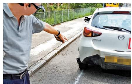
◆周師傅指出車尾被野豬撞凹位置。

香港文匯報訊（記者 蕭景源）一名女「學神」昨日上午由駕駛導師陪同，在北角寶馬山慧翠道學習駕車時，一頭一