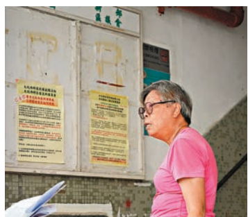
◆年逾70歲的何婆婆現時與女兒兩人一齊居住，她們的訴求是在當區「一屋換一屋」。