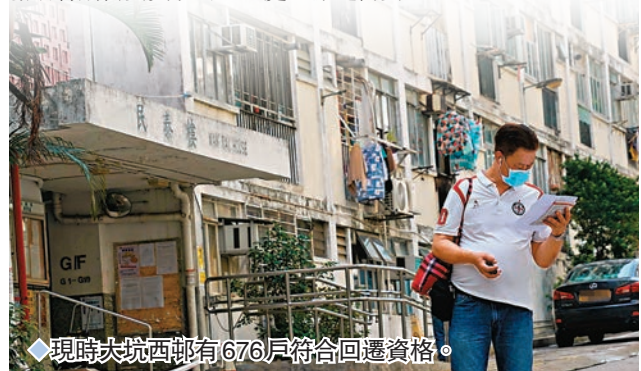
◆現時大坑西邨有676戶符合回遷資格。

為協助有需要的住戶，平民屋宇將繼續派近30名駐邨服務數年社工在場，為居民提供支援服務，包括協助轉介物業顧問以物色及租住居所、協助推薦申請過渡性房屋、派發「搬遷錦囊」、為有需要租戶申請各項社會福利服務或資助，以及協助特別需要支援的居民處理搬遷需要。