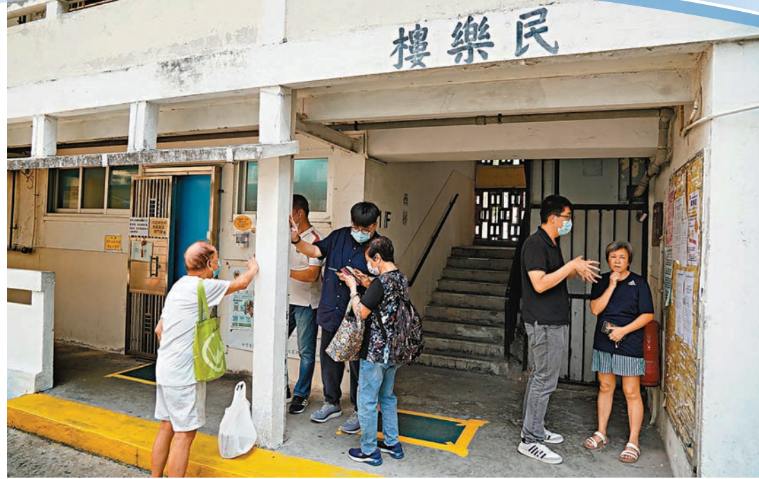
▲住戶在確認資格審核結果及回遷安排，在場有社工向其解釋。