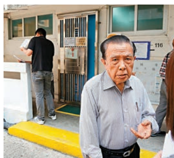
◆郭伯伯坦言自己年過九十歲，「沒人願意租間屋給一個年紀這麼大的人」。