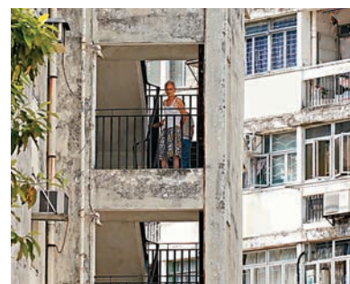
◆大坑西邨年長的居民為數不少。

他說，早前曾有居民尤其是長者租戶，擔心即使有為回遷租戶提供租金津貼，但由於租戶年齡較大，私人樓宇業主未必願意出租單位予他們，故希望香港平民屋宇有限公司可提供進一步協助。對不符合回遷資格的居民，他則建議應盡可能彈性處理，例如經社署評估有體恤安置的合理理由，可考慮容許有關租戶獲回遷安排。