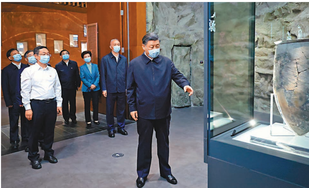
◆6月2日，中共中央總書記、國家主席、中央軍委主席習近平在北京出席文化傳承發展座談會並發表重要講話。這是座談會前，習近平2日下午在中國歷史研究院考察。