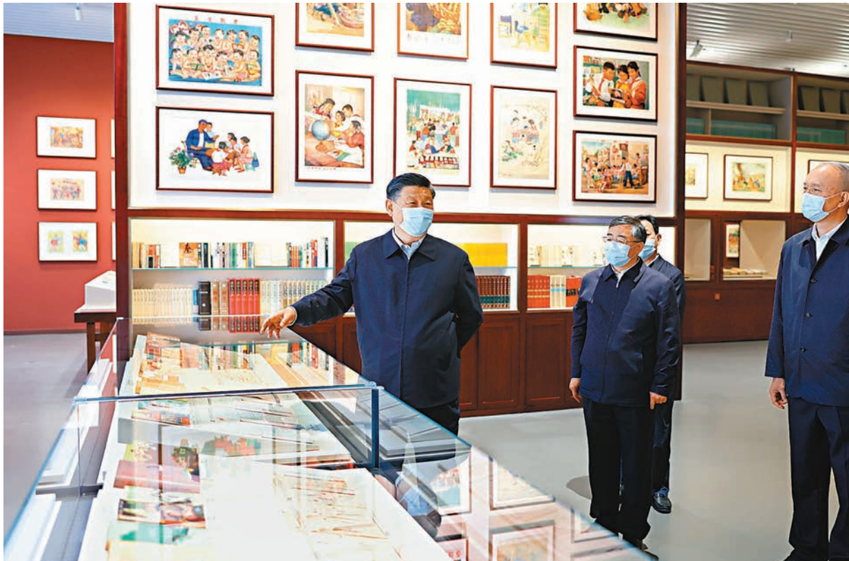
◆6月2日，中共中央總書記、國家主席、中央軍委主席習近平在北京出席文化傳承發展座談會並發表重要講話。這是座談會前，習近平1日下午在中國國家版本館考察。

李書磊、鐵凝、謝貽琴、秦剛、姜信治等參加上述有關活動。中央宣傳思想工作領導小組成員、中央和國家機關有關部門負責同志、中央宣傳文化系統各單位負責同志，有關專家學者代表等參加座談會。