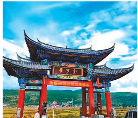
小阿昌村

河在麗江玉龍納西自治縣西南部，西靠老君山，北鄰金沙江。老君山連綿盤亘數百里，層層疊疊，時起時伏。主峰「金絲玉峰」海拔4,515米，被歷代史家稱為雲南「眾山之祖」，因傳說太上老君曾在此煉丹而得名。九河地界是麗江城的重要前哨和關口，元、明、清史料書中有多處關於九河關、哨、鋪、汛、塘的記載。這裏南與大理州劍川交界，往南便可進入大理和昆明，通往中國內地和東南亞，可以稱得上麗江的南大門；北與石鼓、龍蟠毗鄰，往北通往香格里拉與西藏，是滇藏茶馬古道的要隘。九河納西語叫「基塢」，白族語稱為「九塢」。「塢」在漢語中的意思是地勢周邊高中間低窪的地方，又引申為村寨、小城堡。「基」在納西語中為水之意，九河壩歷史上長期被水淹沒。「基塢」是指有水面的地方或河谷。也有說九河來自九禾、九和，「河」是從「禾」或「和」字演變而來，說明和姓(納西族)是此地的開拓者，最早的居住者之一。九河在納西族地區處於十分重要的地位，是東西部納西族區域連接的地帶和南接大理的邊界。九河處在南來北往的交通要道上，深受各種文化的影響，形成多元宗教、多種崇拜並存共融、各行其道、相安無事、信而不篤的形態，這也是麗江宗教文化的縮影。九河民間普遍信奉東巴教等原始宗教，但對藏傳密宗、本主崇拜、道教等的信奉也較為突出。在九河，每個自然村寨都建有不同類型的廟宇，同時普遍有魁星閣、祭天場等等。其中的白王廟歷史最為悠久，可追溯到白王塔建塔的年代。白王塔的來歷，就源自著名的九河(九禾)之戰，是雲南歷史上一個重要的標誌性事件。