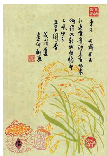
曹丕與朝臣書 江表惟長沙名有好米，何得比新城櫻稻邪？上風吹之，五里聞香。

到底曹丕和曹植兄弟二人，誰的文才較高？劉勰在《文心雕龍·才略篇》中說：「魏文(曹丕)之才，洋洋清綺，舊談抑之，謂去植千里。然子建思捷而才俊，詩麗而表逸，子桓慮詳而力緩，故不競於先鳴……」沈德潛在《古詩源卷五》中說：「子桓詩有文士氣，一變乃父悲壯之習矣。要其便娟婉約，能移人情。」歷來許多文人均讚賞曹丕之才不遜於其弟子建，可嘆的是一般人以曹丕身為帝位之尊而被滅才，而子建際遇不好而加上同情分。 不談文學，曹丕作為一國之君，有其德政，他效法漢文帝施行清靜無為，與民休息的政策，對久經戰禍的人民是一種好處。提到民生最重要的稻米，他富有感情地說：「上風吹之，五里聞香。」 是的，飯滾時的香味隨着炊煙而散發。最近三年，為了控制膽固醇和體重，我改變了吃飯習慣，果然得益。自懂事以來，我們吃飯都是一口飯加一小撮鹽菜，一同咀嚼而吞下。現在我是吃飯前先吃一碗菜，然後吃飯，分量比平日減少三分之一，但每口飯慢慢咀嚼，待飯味出來了，滿口香甜，飯中的澱粉質轉化為糖分才吞下，最後才吃少許菜和肉。如此而已，身體各方面都得以改善。倘年過七十，這個新的吃飯習慣，你也可以嘗試，對健康一定有着。