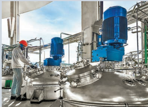
◆Olon將部分能源成本轉嫁藥廠，但不排除藥廠會因而停產。

香港文匯報訊 全球能源價格在通脹潮中一度居高不下，影響到歐美不少基礎藥物生產。《華爾街日報》指出在今年初，阿莫西林、頭孢菌素、退燒藥和鎮痛藥等基礎藥物，在歐美多地都供不應求。藥廠指出由於能源價格高企，生產這些需求量很少波動、利潤率微乎其微的基礎藥物，幾乎無利可圖甚至虧損，產量自然會打折扣。