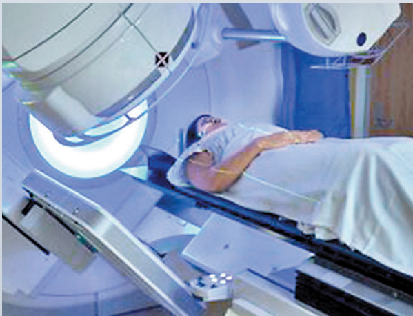
◆即使在美國大型癌症中心，抗癌藥也供不應求。

香港文匯報訊 美國藥物短缺問題愈演愈烈。《紐約時報》近日報道，全美已有逾300種重要藥物短缺，包括抗癌藥、抗生素和專科藥物等。醫學專家警告，美國藥物短缺已構成公共衛生危機，無數癌症等嚴重疾病的患者，都面臨治療延誤風險。