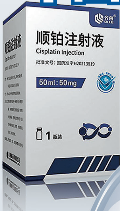
◆齊魯製藥其中一款順鉑產品。網上圖片