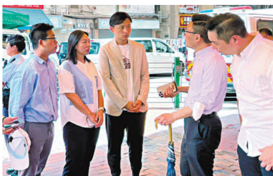
◆有立法會議員事後到現場了解。

另外，民建聯立法會議員鄭泳舜亦指，事件中3名少數族裔女童不幸喪生，令人感到非常心痛及惋惜，他呼籲市民大眾要多關心身邊的朋友及有需要人士，如須支援，可尋求專業人士協助。