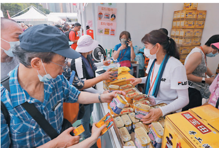
◆市民熱烈搶購，有攤檔在廣告紙上打下叉號以示售罄。