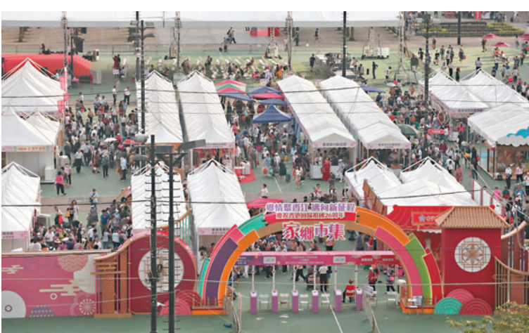
◆一連3天的家鄉市集嘉年華昨日在維園圓滿閉幕。圖為活動結束前，場內依然人山人海。