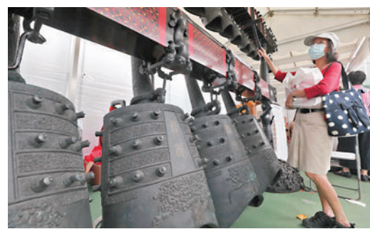
◆市民參觀香港湖北社團總會攤位設置的編鐘。