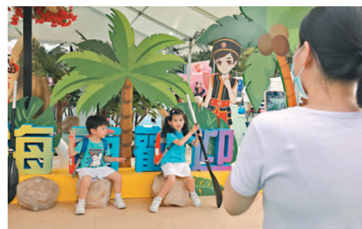
◆香港海南社團總會設置充滿海島風情的打卡點，吸引家長帶同小朋友一起影相留影。