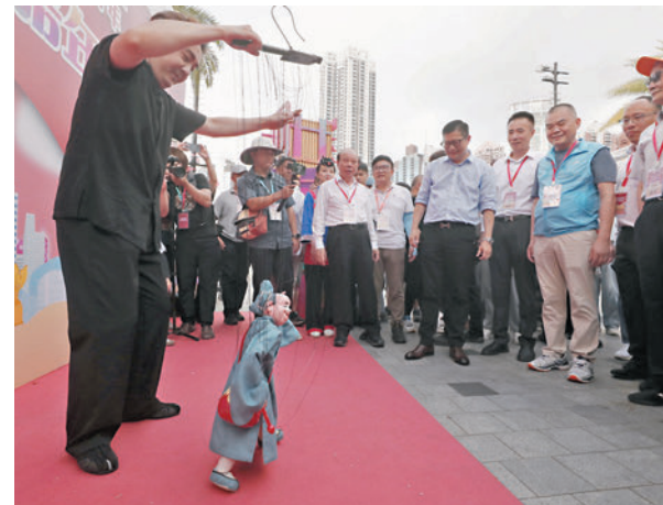
◆鄧炳強在龔俊龍、施清流、余德聰的陪同下觀看泉州提線木偶戲表演。