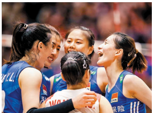
◆中國女排隊員互相鼓勵。