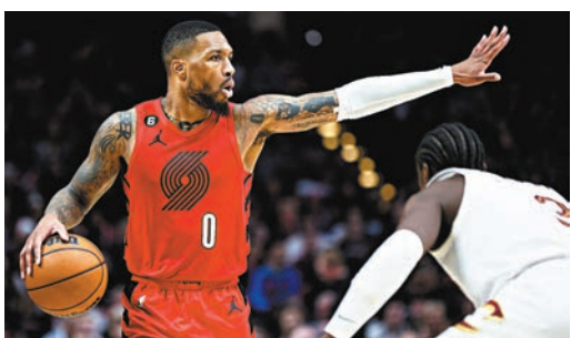
◆利拿特在NBA賽場一舉手一投足都盡顯霸氣。

是次活動邀請多間非牟利慈善團體、組織及學校參與，包括新嘉園協會、希望種子籃球亞洲、飛躍新世界、香港東方籃球隊青年軍、創奇國際體育學校、拔萃男書院、聖若瑟書院及協恩學校，共24位青少年籃球員進行訓練及比賽，利拿特將親身指導，傳授超遠程三分絕技，並送贈籃球裝備予年輕球員以作鼓勵。是次活動為邀請活動並將不安排公開售票，如有興趣入場之球迷，可登入 https://www.kickscrew.com/pages/damian-lillard-hong-kong-2023 贏取活動入場門票。