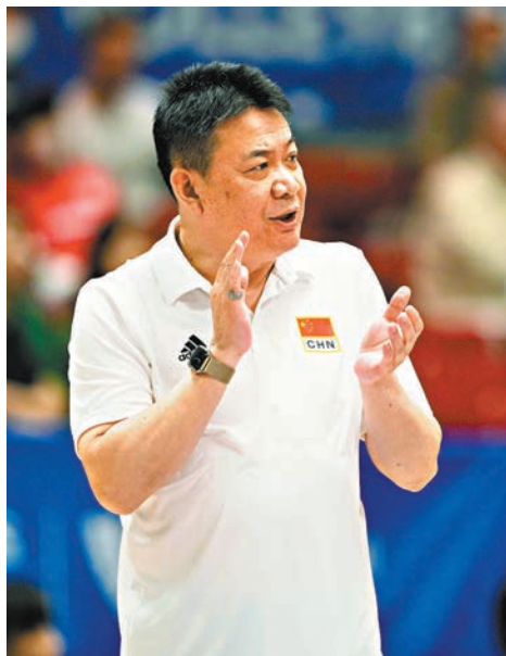
◆中國隊主教練蔡斌為女排姑娘鼓掌。