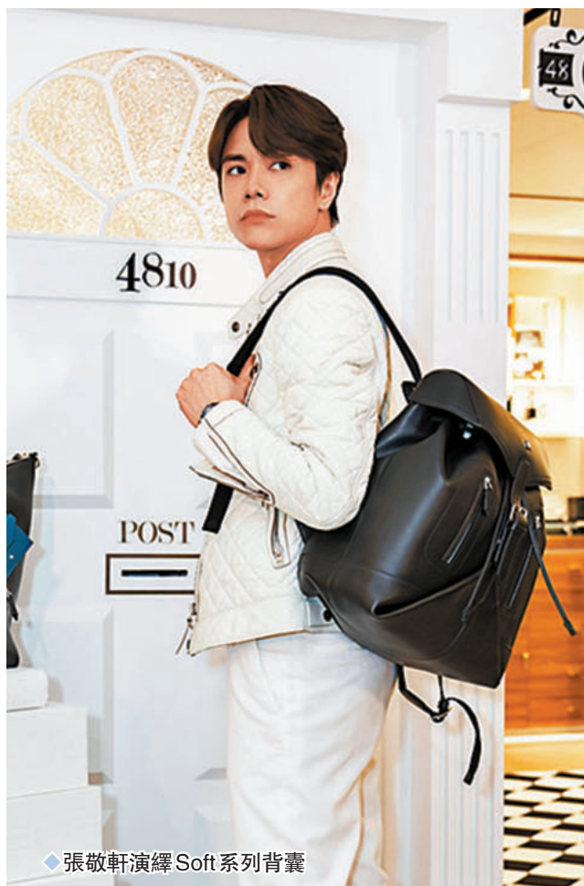
◆ 張敬軒演繹 Soft 系列背囊