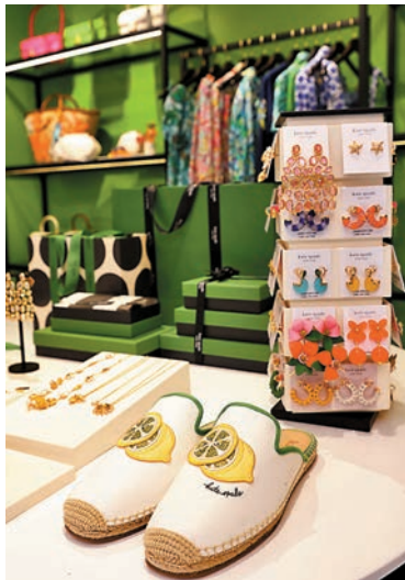
◆ 獨家限定款手袋、小皮具及珠寶