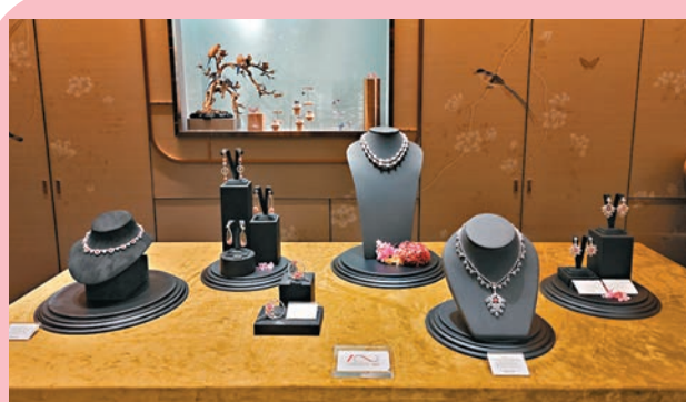
◆ 海螺珍珠珠寶藝術展覽

為頌讚 The Library Spirit，Montblanc 將位於尖沙咀海洋中心的專門店轉化為一間英式圖書館，其靈感來自書本印刷的黑白色調，摻入了少許綠色，彌漫著淡淡的古典文學氛圍。品牌更將不同的文學經典金句貫穿不同區域，令大家穿梭其間，發掘不同的驚喜。這推廣活動中的主要作品亦在圖書館內展出，供賓客探索，當中包括以書寫藝術為靈感、外側附有筆套的 Soft 系列迷你包，以及專為當今忙碌的探險者打造的 Soft 系列背囊與 Soft 系列 24/7 收納袋。