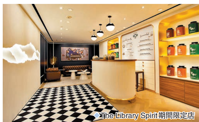
◆ The Library Spirit 期間限定店