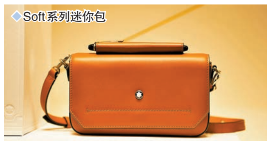
◆ Soft 系列迷你包