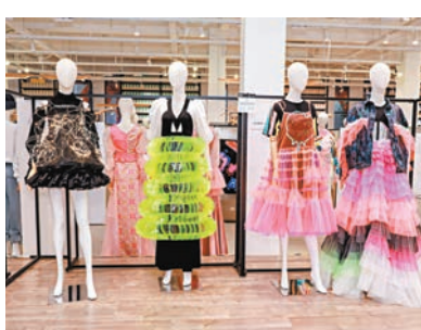
◆ 名為《霓虹黯色》的時裝作品

讓人印象深刻的是，來自粵港澳大灣區的新銳品牌設計師們，普遍關注環保話題、關注人類與自然如