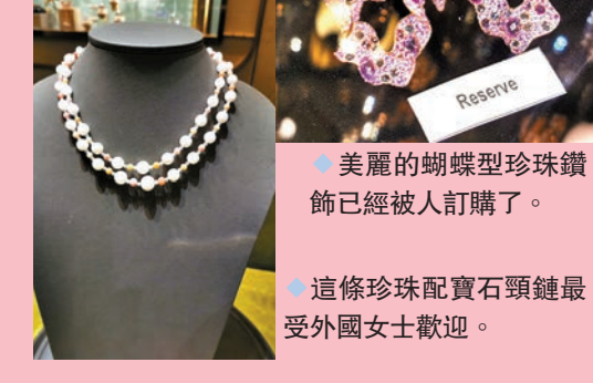
◆ 美麗的蝴蝶型珍珠鑽飾已經被人訂購了。