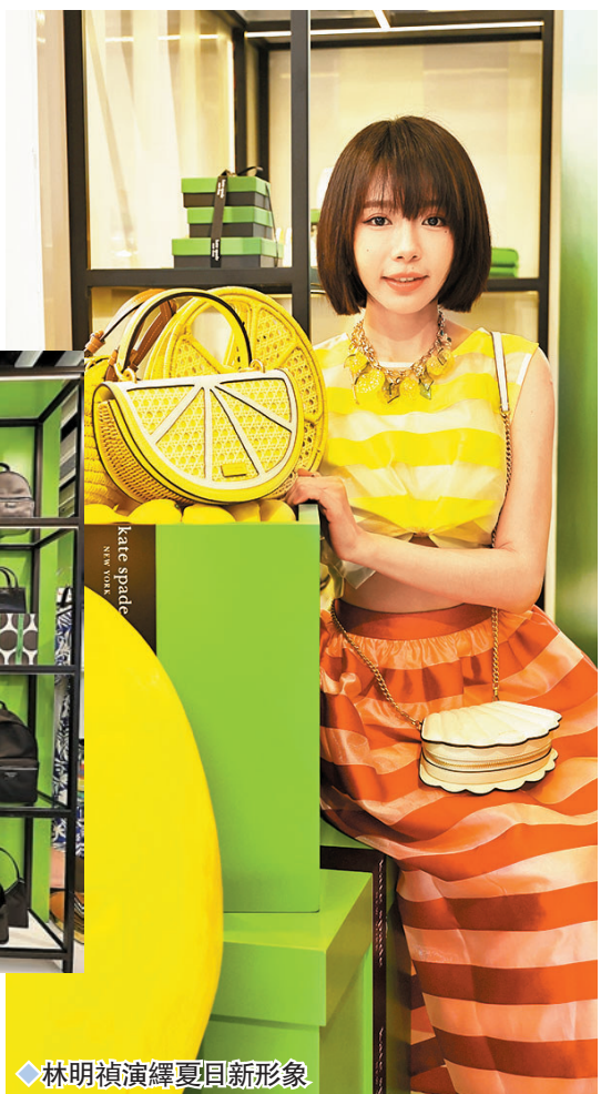
◆ 林明禎演繹夏日新形象