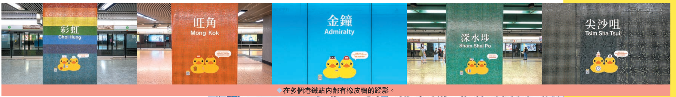
在多個港鐵站內都有橡皮鴨的蹤影。