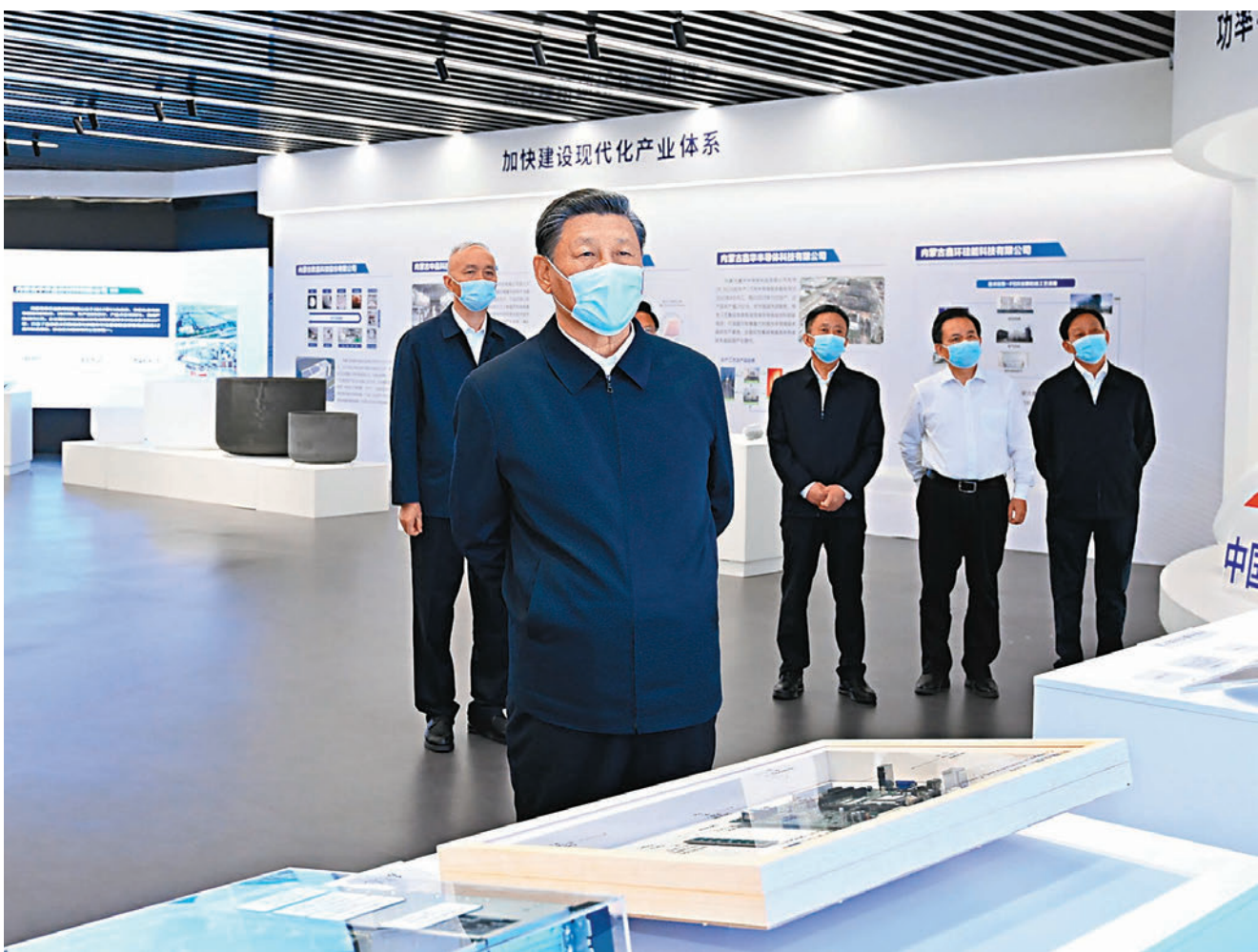
◆ 6月7日至8日，中共中央總書記、國家主席、中央軍委主席習近平在內蒙古考察。這是7日下午，習近平在呼和浩特市中環產業園考察。

6月7日至8日，習近平在巴彥淖爾市考察並主持召開加強荒漠化綜合防治和推進「三北」等重點生態工程建設座談會後，在內蒙古自治區黨委書記孫紹驥、自治區人民政府主席王莉霞陪同下，來到呼和浩特市調研。