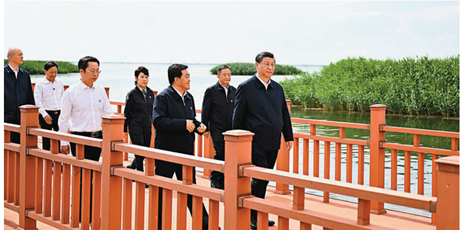
◆ 6月5日至6日，中共中央總書記、國家主席、中央軍委主席習近平在內蒙古巴彥淖爾考察，並主持召開加強荒漠化綜合防治和推進「三北」等重點生態工程建設座談會。這是5日下午，習近平在烏梁素海考察。