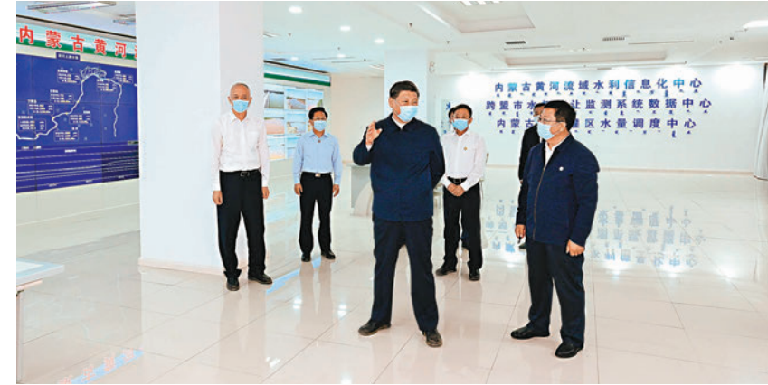
◆ 6月5日至6日，中共中央總書記、國家主席、中央軍委主席習近平在內蒙古巴彥淖爾考察，並主持召開加強荒漠化綜合防治和推進「三北」等重點生態工程建設座談會。這是6日上午，習近平在河套灌區水量信息化監測中心考察。