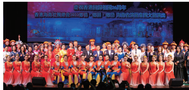
▲謝幕時，嘉賓和演藝人員合影留念。

日前，「慶祝香港回歸祖國26周年—香港海南社團總會2023鄉情·鄉韻·鄉戀 海南省演藝集團文藝演出」假北角新光戲院圓滿舉行，活動致力於在香港講好海南故事，為深化瓊港合作貢獻力量，更讓各位旅瓊瓊籍鄉親歡聚一堂，共同感受家鄉風情，暢敘桑梓情深，活動節目精彩紛呈、充滿濃厚的海南文化氣息，吸引了逾千名同鄉、市民進場觀看。