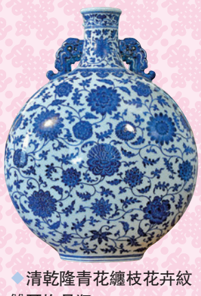
◆清乾隆青花纏枝花卉紋雙耳抱月瓶