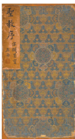
◆宋拓《懷仁集王聖教序》