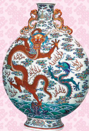
◆清乾隆門彩蒼龍教子圖雙龍耳抱月瓶