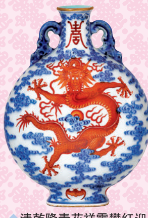
◆清乾隆青花祥雲雙龍迎面龍紋雙耳抱月瓶

在剛剛落下帷幕的佳士得春季拍賣會中，清宮御寶再次引領佳績。5月30日下午，一件體形碩大的「清乾隆門彩蒼龍教子圖雙龍耳抱月瓶」引起各方關注。這尊絕美的重器，主體紋飾爲「蒼龍教子圖」——以鑲紅彩繪製出一條象徵帝王的五爪遊龍，一旁象徵儲君的五爪青龍抬頭仰望。最終這件抱月瓶以1.08億港元的連佣成交價，摘下香港五月拍賣周的成交桂冠。