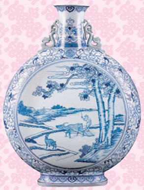
◆清乾隆青花繪水牛農夫雙耳抱月瓶

「扁壺」或「寶月瓶」，創燒於明代，肩部附飾雙耳，相對細短的直頸向下延伸出飽滿圓滑的扁圓腹，形似滿月。據傳是由波斯、西亞地區傳入，是便攜的盛水裝酒用具。 到了清代，這種器形在清宮的正式名稱爲「馬掛瓶」，因此亦有一部分學者認爲這種器型可追溯至西夏之陶製的馬鞍側瓶。乾隆皇帝對這種器型鍾情有加，在明代以青花爲主要裝飾的基礎之上，加入更多形制與紋飾花樣的變化。筆者的收藏之中，亦有一件小巧的「清乾隆青花祥雲雙龍迎面龍紋雙耳抱月瓶」，外壁白地並用青花繪製雲朵，並以鑲紅彩描繪頸部的「壽」字紋、腹部的騰龍以及足部的蝙蝠；另外有一件體形碩大的「清乾隆青花春耕圖雙耳抱月瓶」，前後腹部各飾一大型圓形開光，內繪農夫放牛春耕的畫面，邊框環飾規整的纏枝牡丹紋。