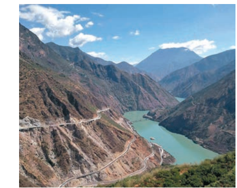
金沙江渡口

這也是終身學習的適應性選擇，無須依賴他人告訴自己這樣做是有價值的，能從學習的過程中獲取樂趣，塑造自我品格，培養出吃苦耐勞的能力以及攻克難關的決心。即使從現代功利性角度說，當終身學習不再被視為獲取工藝技巧或謀生技巧的一個要素，而是開拓人生視野和胸懷的一種工具，這樣的人相信也不會缺少工作機會，更無懼時代的變化，因為這樣的特質永遠都不會過時，到哪裏工作都會需要。