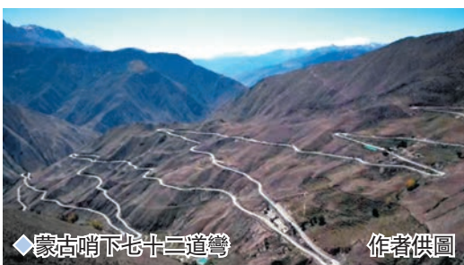
蒙古哨下七十二道彎 作者供圖

從鋪子村沿金沙江北上，經龍潭和上元村到渡口村。渡口村就是歷史上有名的阿喜渡口。從阿喜渡口過金沙江就是中甸香格里拉市。其實從蒙古哨經七十二道彎到金沙江邊的鋪子村，再從鋪子村到阿喜渡口，這一帶沿金沙江的地區歷史上一直都被稱為「阿喜」。「阿喜」一名在明代已有明文記載。阿喜地區與麗江的地方歷史密切相關，尤其是與納西族、金沙江和茶馬古道的歷史關係尤為密切。