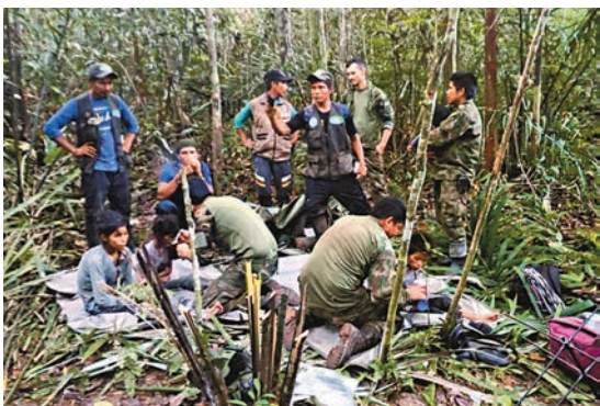
軍方人員在叢林發現4名兒童後，向他們餵食。

搜救任務現改稱「奇跡行動」，當局表示這段期間投入112名特戰人員、92名原住民，搜救路線714公里。