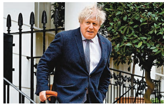
約翰遜不排除日後會重返政壇。資料圖片