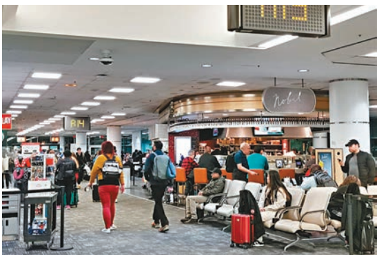
外國人即使只在加拿大過境，亦必須申請eTA簽證。

款，導致她損失數千加元。英國是其中一個受波及的eTA系統原有國家或地區，其他還包括日本、歐盟國家、澳洲、韓國和香港。