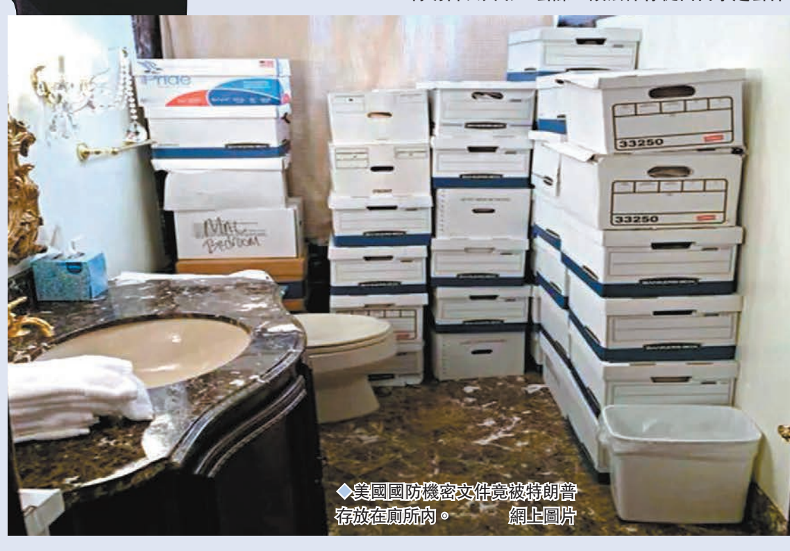
美國國防機密文件竟被特朗普存放在廁所內。