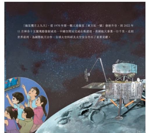
◆有關太空安全等國家安全重點領域，對小朋友而言最具吸引力。