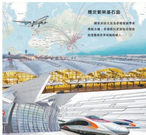
◆政府已派贈6萬本全新的《國家安全 穩定繁榮基石》兒童繪本予全港小學。圖為「穩定繁榮基石」一節的部分插圖。

繪本還提醒同學，國安才能家好，國安才能業旺。維護國家安全人人有責、義不容辭。維護國家主權、安全和發展利益是香港特區的憲制責任，亦與香港市民息息相關。我們每個人都是自覺維護國家安全的參與者、推動者、受益者，而不是旁觀者。人民安全是國家安全的基石，國家安全一切為了人民、一切依靠人民。