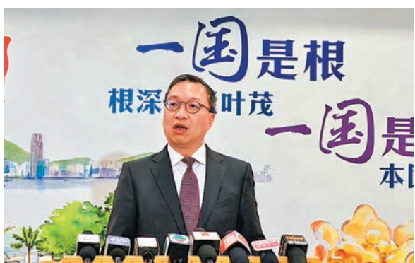
◆林定國指，在草擬法律時一定要很敏感，起到維護國安的作用。

香港文匯報訊（記者 林熹）基本法二十三條何時能完成立法問題備受外界關注，香港特區政府律政司司長林定國昨日強調，特區政府認為要盡快進行第二十三條立法，希望今年做出成績，否則希望明年可以完成。他指出，立法的挑戰在於國家安全的風險不斷轉變，國際大氣候和政治環境愈來愈複雜，在草擬法律時一定要很敏感，起到維護國安的作用。 林定國在港台昨日播出的《國安法事件簿2》節目中表示，香港作為普通法管轄區，在制訂法律時要參考和研究外地情況，借鑑其他