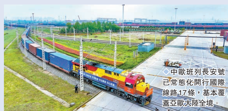
◆中歐班列長安號已常態化開行國際線路17條，基本覆蓋亞歐大陸全境。

業內人士表示，粵港澳大灣區是中國外貿最發達、最頻繁的地區，近年來廣鐵集團積極推動打造「軌道上的大灣區」，助力香港進入全國高鐵網。特別是隨着粵港澳大灣區中歐班列開行數量不斷增加，開行路徑不斷擴大，不僅對打造粵港澳陸上「絲綢之路」大通道，促進