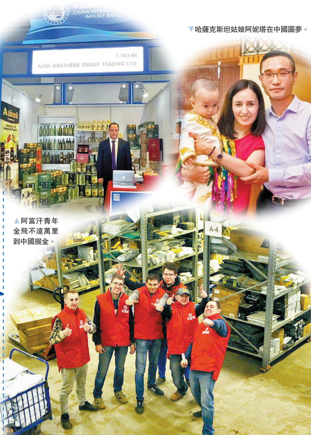
▲阿富汗青年金飛不遠萬里到中國掘金。