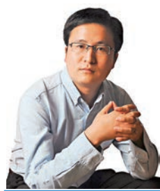
宋清輝 著名經濟學家