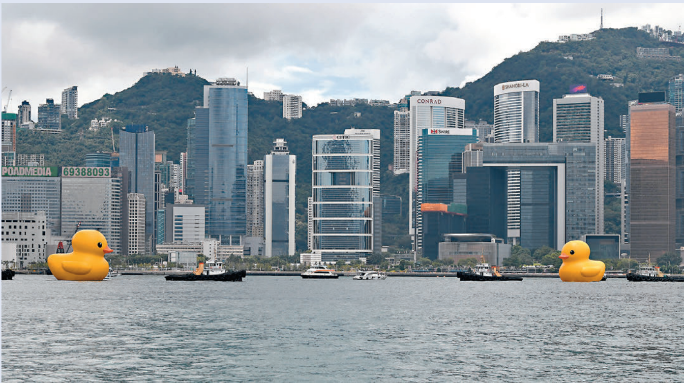
◆香港今年全面復常，諸多大型活動重臨，經濟活力亦重現，多項數據向好。圖為近日「大黃鴨」游維多利亞港。