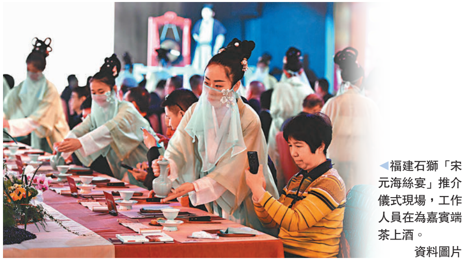
福建石獅「宋元海絲宴」推介儀式現場，工作人員在為嘉賓端茶上酒。