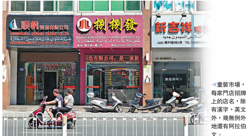
童裝市場，每家門店招牌上的店名，除有漢字、英文外，幾無例外地還有阿拉伯文。