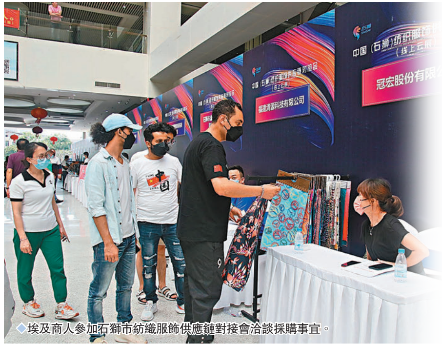
埃及商人參加石獅市紡織服飾供應鏈對接會洽談採購事宜。