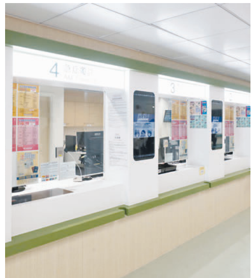
▲急症室登記處。