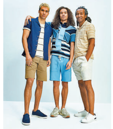
◆ Goodmove 系列運動服飾