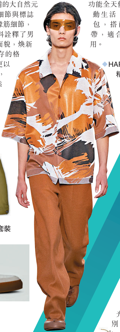
◆ HARVEY NICHOLS 精選時裝

或嚴肅，或親切，或認真，或風趣……不同面貌的父親，對家人的關愛卻是同樣無微不至，而充滿親情暖意的父親節將至，不少品牌臻選了一系列精品作為最具誠意的父親節禮物，為父親帶來舒適時尚的夏日造型，並使當代男士可同時表現活力及紳士風範，予父親表達謝意，共度愛的節日。現在，多款精選時裝、腕錶、配飾及足金擺設，各具象徵意義，藉此向父親聊表心意，定能叫他喜出望外，由外暖入心！