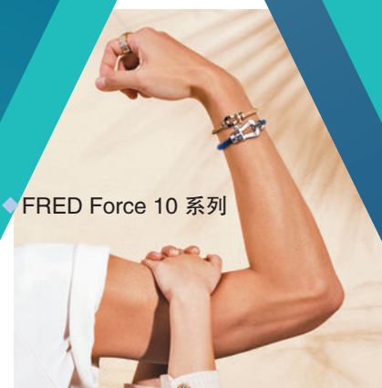
◆ FRED Force 10 系列