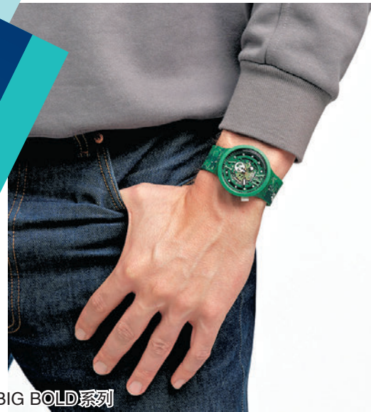
◆ Swatch BIG BOLD 系列