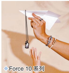
◆ Force 10 系列

景福珠寶足金金器外形美觀，往往包含深遠的寓意，除可為家居或辦公室作時尚點綴之外，更具實際的保值作用，適合送給穩重務實的父親來表達謝意。一系列不同造型的足金擺設做工精緻，為父親獻上盡在不言中的感謝和祝福，其中足金蝦擺件將其活力動感的姿態演繹得維妙維肖，向父親同時送上兩款擺件，象徵「哈哈大笑」及精力充沛的吉祥寓意。