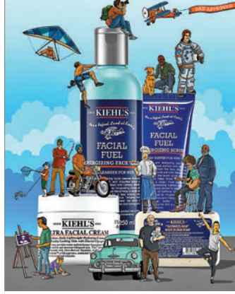
◆ GREAT GIFTS FOR YOUR ONE-OF-A-KIND DAD