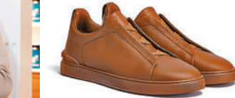
◆ ZEGNA 夏季全新系列