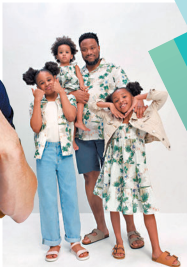
◆印有熱帶圖案的親子裝系列