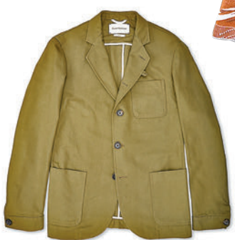
◆ OLIVER SPENCER 麻質套裝