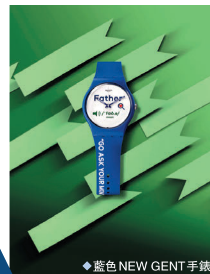
◆ 藍色 NEW GENT 手錶