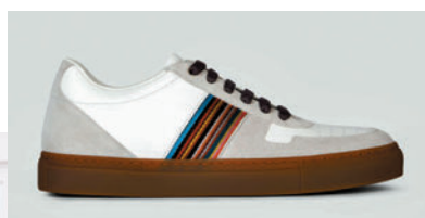
◆ Paul Smith 鞋款