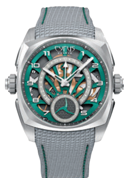
◆ Klepcys GMT Palm Green

Swatch BIG BOLD 是一款展現個性的超大手錶，這款都市感設計首次採用令人意想不到的迷彩花卉圖案貫穿深綠和赤陶色調的錶帶，同時亦為具標誌性的內部機芯着色。而且，這些特別版手錶以幽默的方式詮釋了「Daddypedia」的概念，這些經典短句大多數人曾斷言絕不會說出口，卻在成為父母後不經意脫口而出！錶帶上飾以有趣的「Go Ask Your Mom（去問你媽媽）」文字，適合無論是經驗豐富或新手爸爸的形象。藍色 NEW GENT 手錶採用夜光指針，就像 ALL ABOUT MOM 特別版手錶一樣，日曆輪上飾以不同顏色的心形，並會於每天的午夜到凌晨 2 點之間變換。