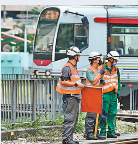
未來幾年有「三鐵三路」等工程，建造業估計缺少數萬人手。圖為鐵路工程人員進行戶外工作。資料圖片

他強調政府仍堅持本地勞工優先，輸入外勞僅是輔助性質，而非永久性措施，「名額是滾動的，一直運轉，例如1.2萬人進來，當中有人來有人走，如有一千人離開，便重新有一千個名額。」