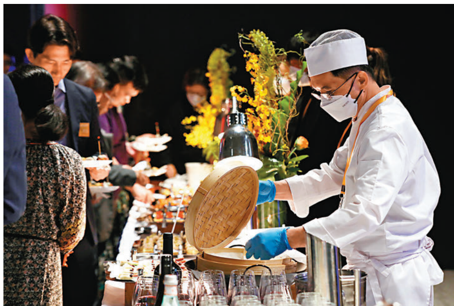
▶酒店業全行現時欠缺9,000多名員工，餐飲部是重災區之一。