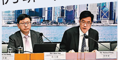
◆孫玉菡（左）與黃偉倫 資料圖片

香港文匯報訊（記者 文森）特區政府擬議建造業及運輸業兩個行業合共輸入兩萬名勞工，財政司副司長黃偉倫昨日接受電台節目訪問時透露，兩萬名額估計只佔有關行業人手缺口的一半，期望其他空缺可由本地員工填補。他表示，特區政府將會每季分發輸入名額，首批2,000名建造業外勞最快今年第四季抵港。另外容許外勞即日返回內地居住，是為提供彈性，亦可減輕本港社區壓力。