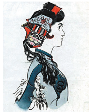
黃永玉木刻作品《阿詩瑪》。網上圖片