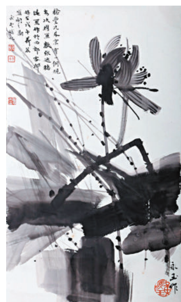
黃永玉水墨畫作品《墨荷》。網上圖片