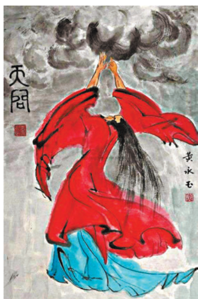
黃永玉水墨畫作品《天問》。