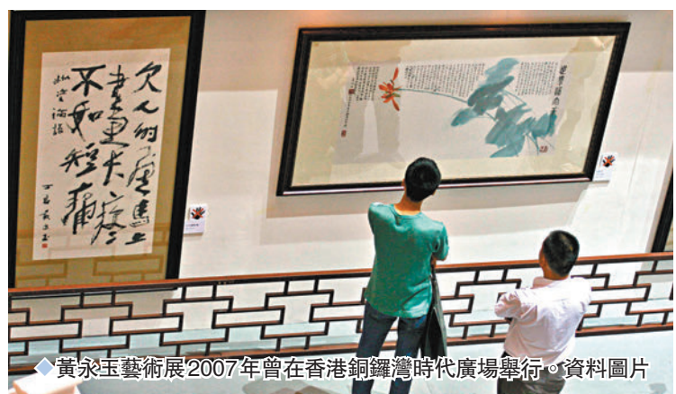
黃永玉藝術展2007年曾在香港銅鑼灣時代廣場舉行。資料圖片

香港特區政府文化體育及旅遊局局長楊潤雄對黃永玉逝世深感痛惜,並向其家人致以慰問。「黃永玉的離去教我們惋惜,但他的作品將流傳後世,我們永遠懷念他。」楊潤雄讚揚黃永玉在畫壇享負盛名,屢獲殊榮,作品獨具風格,既有濃厚中國畫氣韻又具西方繪畫元素,畫風啟迪不少後進。黃永玉亦是出色的版畫家和詩人,詩風質樸動人,發人深省。香港藝術館曾於2004年為他舉辦八十歲回顧展,亦藏有八件他的水墨作品和版畫。