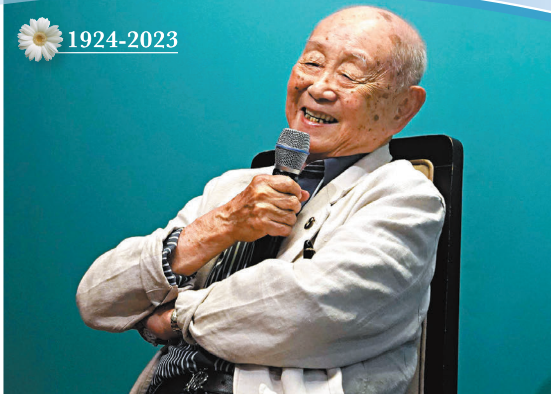
黃永玉於6月13日3時43分逝世,享年99歲。