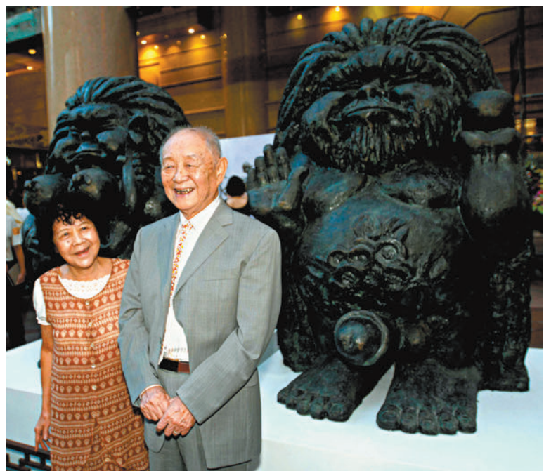
黃永玉和夫人張梅溪生前照片。

黃永玉也將文學視為自己最傾心的「行當」,從事文學創作長達七十餘年。詩歌、散文、雜文、小說諸種體裁均有佳作。先後出版《永玉六記》《吳世茫論壇》《老婆呀,不要哭》《這些憂鬱的碎屑》《沿着塞納河到翡冷翠》《太陽下的風景》《比我老的老頭》等作品。2013年,黃永玉的長篇小說《無愁河的浪蕩漢子》出版,是一部投射式的人生自傳。在99歲高齡時,黃永玉又出新作《見笑集》,收錄了從1947年到2021年的全部詩歌,是黃永玉一生閱歷與情感的抒懷,也是歷史變遷的見證。