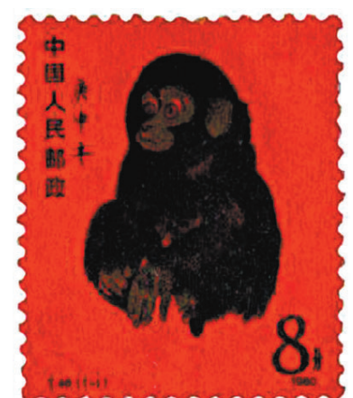
黃永玉設計的生肖郵票開山之作——庚申年猴。