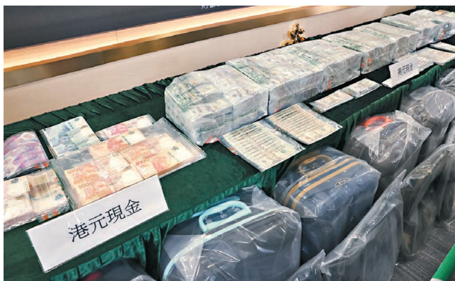
海關展示涉案行李篋、背囊、手提電話及銀行單據等證物。

有洗黑錢集團招攬「搵快錢」的年輕人組成「運鈔黨」,於5個月內41次從土耳其攜帶合共9,100萬美元現鈔(約合7億港元)返港,並向海關訛稱代表土耳其公司用來買賣鑽石或珠寶。由於該11名「運鈔黨」成員「密密飛」引起海關注意,追查發現大筆現金全部被運到尖沙咀兩間空殼公司處理分發,涉及洗黑錢。海關由上月25日至本月13日展開代號「圍擊」行動,拘捕該集團主腦及「運鈔黨」共23人,檢獲534萬美元現金。這是海關偵破的歷來最大宗航空旅客運送清洗黑錢案,正追查資金來源及流向。