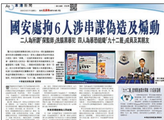
◆警務處國家安全處調查黑暴「探監師」案時,於月初以涉嫌串謀偽造及煽動罪拘捕6人。資料圖片

警方懷疑有人裏應外合勾結在囚者,假冒在囚者之名簽署文件,企圖為兩名被羈押的黑暴分子製造「福利」,推展所謂的「光復懲教」計劃。6人涉嫌干犯香港法例第200章《刑事罪行條例》第159A條及71條「串謀偽造」。 6人中,一名64歲婦人及案中另一名33歲男子還涉嫌危害國家安全,包括多次透過社交平台持續發布具有煽動意圖的信息,內容涉及煽動他人引起對中央及香港特區政府的憎恨、鼓吹「港獨」以及武力對抗等言論,干犯香港法例第200章《刑事罪行條例》第九及十條「作出具煽動意圖的作為」罪。 被捕6人其後獲警方保釋候查,但涉案的64歲婦人透過另一名30歲男子,聯絡「串謀偽造」案中其他5名涉案者,涉嫌干擾警方的進一步調查取證。國安警昨日再度拘捕婦人和30歲男同黨,並