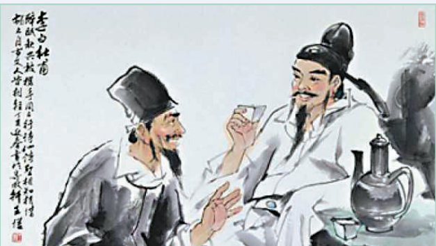
◆李白是杜甫的偶像。

說起李白，我們很難不聯想到「酒」；彷彿，他的人生就是用美酒灌溉而成。而說到李白的酒詩，我相信大部分人首先想到《將進酒》——「斗酒十千恣歡謔」、「呼兒將出換美酒，與爾同銷萬古愁」，氣魄之大，足以讓七尺兒郎也為之屈膝。另一首《月下獨酌》，開首便以獨酌無親的「花間一壺酒」，力邀明月共飲。可憐的李白，此時此刻只有「月」與「影」，其孤獨寂寥之意，足以讓含嬌倚欄的少女為之潸然淚下。