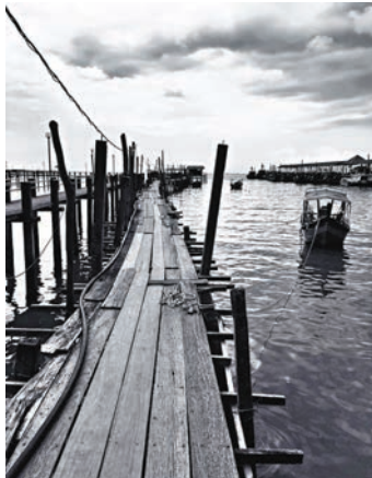
后海灣過去，木橋帆影處處，海天一色。

地球縱橫馳騁停不下來，每日關注，望着籌辦群諸君不停理順各則細節，感恩族中新一代青壯豪傑接班，按序就章，深信6月18日全日的盛會必將成功舉行，圓滿結束。 英文有字 Conformist，其相反詞乃 Non-Conformist；中文詮釋，始終找不到神似，甚至形似也有距離。 在下在眾人眼中，從來是個如假包換 Non-Conformist；獨來獨往、反叛、我行我素不理後果！ 時光荏苒，歲月流逝，審視自己；其實心存不折不扣濃重鄉土情懷，從家鄉事務角度看，亦也 Conformist。 不時無影無蹤進出香港，現身協助比較困難，惟有盡一己筆力，為鄉里而推廣之，為益惠家族傳統文化諸君，獻上至盛謝意。