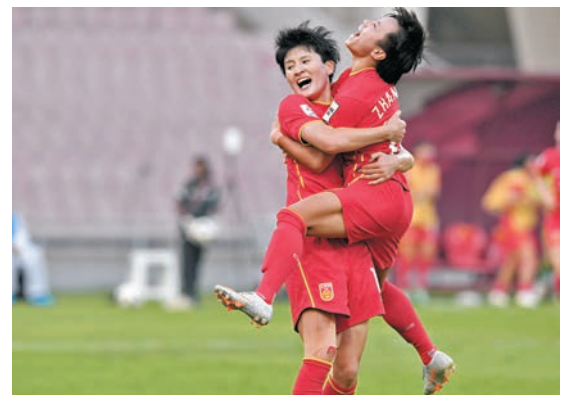
◆中國女足翼創佳績。資料圖片

中國男足亞運隊將於6月15日和19日與韓國U24男足兩次交手。「有針對性的戰術訓練很重要，球員們需要發揮出應有水平，我也希望通過與韓國隊的比賽檢驗隊伍。」亞運隊主教練久爾傑維奇說。中國籃協6月13日公布了新一期中國男籃集訓名單，隊伍將於6月23日至7月6日在青島進行集訓選拔。