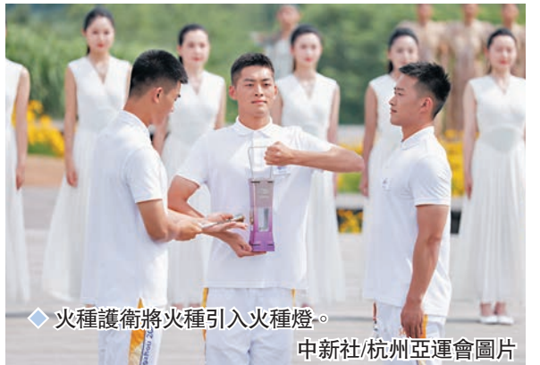
火種護衛將火種引入火種燈。

舉行第19屆亞運會火炬點燃暨火炬傳遞啟動儀式，之後火炬將在浙江11個城市傳遞。 首個線上傳火炬 首個亞運會「數字火炬手」線上傳遞活動在「智能亞運一站通」平台上15日亦同步啟動。本屆亞運會，網民可在支付寶搜索「亞運」，通過訪問「智能亞運一站通」成為「亞運數字火炬手」。截至目前已有超2,100萬的網友成為「亞運數字火炬手」。