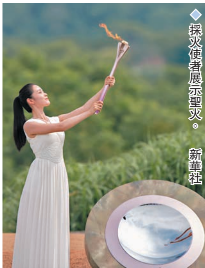
採火使者展示聖火。新華社

香港文匯報訊（記者連恩慈 15日杭州報導）15日，杭州亞運會倒計時100天之際，杭州亞運會火種在良渚古城遺址公園大莫角山成功採集。 上午9時整，火種採集儀式開始。在儀仗隊護衛下，中華人民共和國國旗和亞奧理事會會旗進入會場。在奏唱中華人民共和國國歌和演奏亞奧理事會會歌後，國家體育總局局長、第19屆亞運會組委會主席高志丹，國際奧委會副主席、亞奧理事會顧問委員會主席黃思綿分別致辭。隨後，浙江省省長、第19屆亞運會組委會主席王