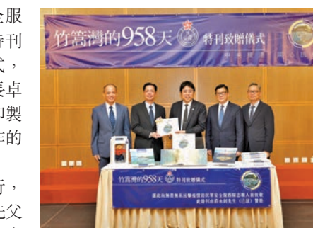
民安隊舉行竹篙灣紀念特刊《竹篙灣的958天》致贈儀式。

香港文匯報訊 民眾安全服務隊昨日舉行竹篙灣紀念特刊《竹篙灣的958天》致贈儀式，在保安局局長鄧炳強和副局長卓孝業見證下，接受一批贊助印製的特刊，贈予曾參與抗疫工作的民安隊人員。