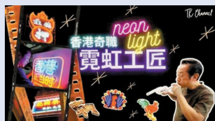
《大公報》推出全新YouTube頻道——「TK Channel 大公生活頻道」。

香港文匯報訊(記者 藍松山) 今日(17日)是《大公報》創刊121周年，《大公報》將同日推出《大公報》全新YouTube頻道——「TK Channel 大公生活頻道」。首集帶大家穿梭大街小巷，齊齊「頭岳岳」尋找瀕臨消失的霓虹燈，與香港僅餘的霓虹工匠聊這種特別的城市美學。