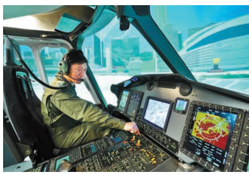
H175直升機模擬飛行訓練器內駕駛艙。