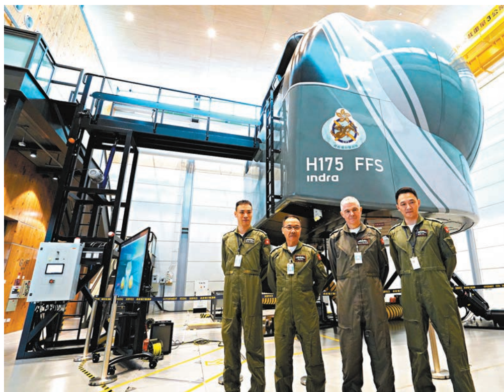
政府飛行服務隊公布引入亞洲首部H175直升機模擬飛行訓練器。