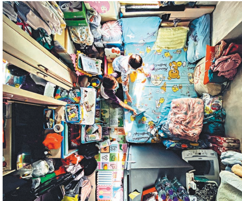
政府構思為低收入劏房住戶提供一筆過非現金資助津貼以改善居住環境。圖為一基層家庭劏房戶。資料圖片

在會議上，委員備悉關愛基金各援助項目的進度及財務情況。除上述的「在校課後託管服務試行計劃」外，委員亦通過由基金推行房屋局負責的「過渡性房屋住戶特別津貼試驗計劃」。該試驗計劃向「支援非政府機構推行過渡性房屋項目的資助計劃」下過渡性房屋項目的住戶提供資助，支援他們搬遷和適應新的居住環境。該試驗計劃的總撥款額約為8,520萬元，預計惠及約35,000人。房屋局擬於今年8月正式推出試驗計劃並接受合資格人士申請。