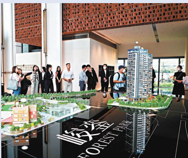
ICC·峻鑾5月中旬在港推出的首批20伙單位全部售罄。