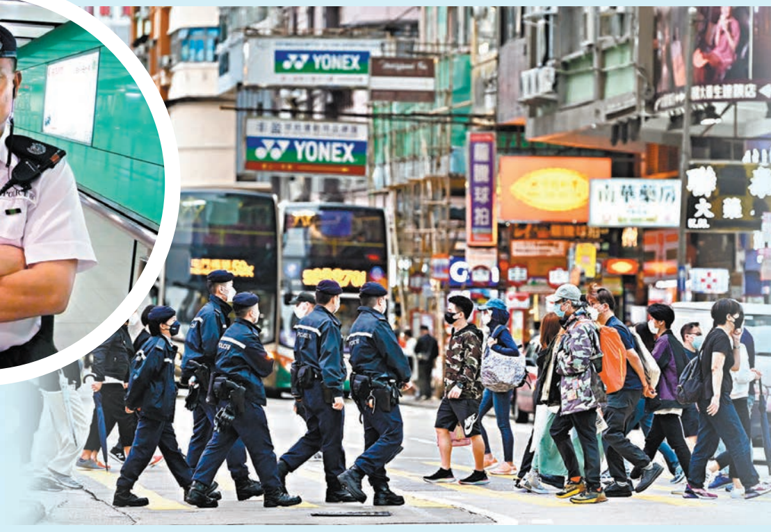
◆千家萬戶今日可以歡度父親節，背後是香港警隊上下默默的付出。圖為香港警察在街頭執勤。

無論天陰天晴，紀律部隊從沒間斷為市民服務。在今日父親節，他們不但不能閒着，不少警員還比平日更忙，近期，多宗嚴重傷人案發生令公眾關注到治安問題，保安局局長鄧炳強早前就透露，警方會調配更多人手到前線作高姿態巡邏。 據了解，各區特遣隊、雜項調查隊等警員近日都換上軍裝到街上巡邏。 考慮到今日父親節，各區大型商場人流上升，警方5個陸上總區刑事部會加派人員執勤。他們將會以十人為一隊，