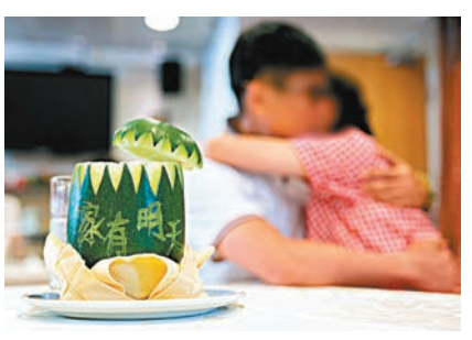
◆懲教署安排五名在囚少女與父親參與活動。

香港文匯報訊（記者 文森）香港特區政府懲教署日前在勵敬懲教所舉辦「友晴Teen使」計劃——「家有明天」父親節親子活動，活動共有5名女性青年在囚者參與。她們的父親在藝人嘉賓洪天明夫婦協助下烹調冬瓜湯。參與活動的在囚者之一阿晴（化名）向父親表達了最深的歉意。