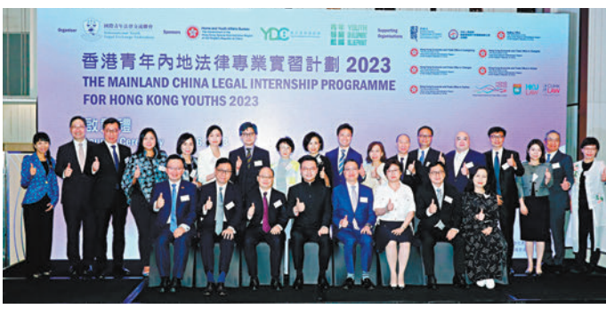
「香港青年內地法律專業實習計劃2023」啓動。

香港文匯報訊（記者 子京）由國際青年法律交流聯會主辦的「香港青年內地法律專業實習計劃2023」昨日啟動，42位來自香港、英國和內地的法律專業學生將於本月底同赴北京，在多間大型律師事務所和主要仲裁機構實習一個月。