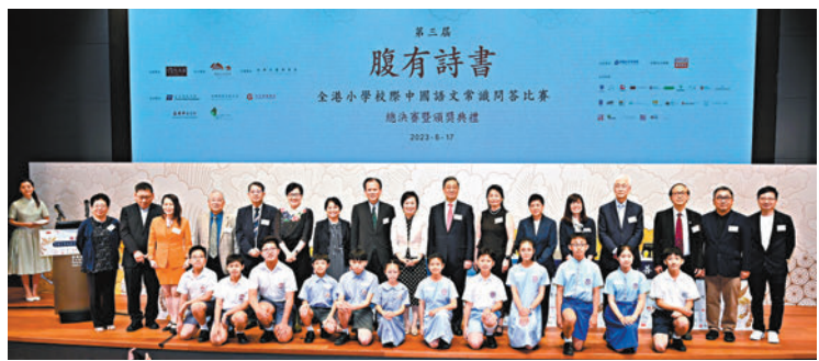
◆第三屆「腹有詩書」全港小學校際中國語文常識問答比賽，參賽學生與嘉賓合照。

香港文匯報訊（記者 高鈺）由灼見名家主辦的第三屆「腹有詩書——全港小學校際中國語文常識問答比賽」總決賽暨頒獎典禮，昨日在香港故宮文化博物館演講廳舉行。聖公會聖彼得小學愈戰愈勇，最終以620分掄元，上屆冠軍隊伍英華小學以560分勇奪亞軍，東華三院羅裕積小學和樂善堂梁錫瑤學校分別以410分和350分獲得季軍和殿軍。