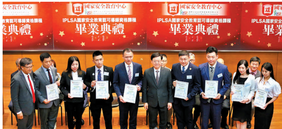
「國家安全教育認可導師資格課程」昨日舉行畢業典禮，50名學員畢業獲得證書。

IPLSA創始人、立法會議員何君堯說，2020年香港國安法出台後，中心全力以赴，為香港莘莘學子建立良好的榜樣，在培養學生國家安全的認識、建立國民身份認同同一份力。