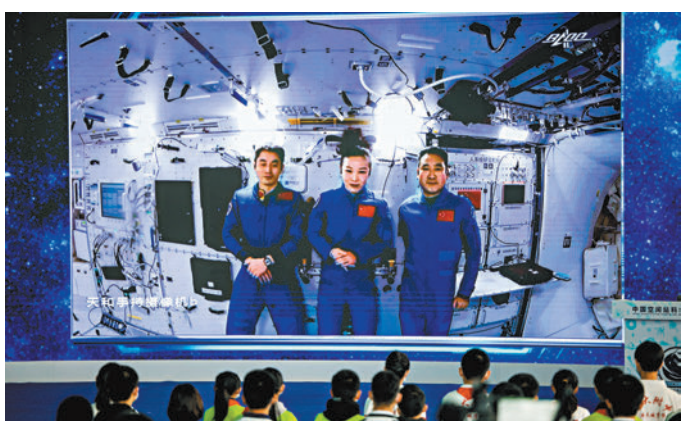
◆中國航天員的艙內「常服」統一以藍色作為底色。資料圖片

最後再来看看中國航天員的「常服」，亦即「天宮」照片中，航天员穿着的那件藍色連體衣。為什麼「常服」選擇藍色，官方未有特別說明。不過，有航天迷認為，因為「天宮」內部以白色為主，如果艙內「常服」是白色，在監控鏡頭中的太空人較難顯現；如果選擇紅、橙、翠綠之類鮮艷顏色，又容易引起視覺和心理疲勞，所以設計師選擇了較舒緩心情的藍色。