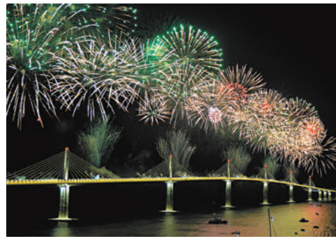
▲佩列沙茨大橋是中國與克羅地亞共建「一帶一路」的標誌性項目。資料圖片