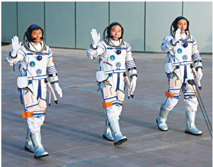
◆中國國內航天服是以白色為主色。圖為神舟十六號載人飛行任務航天员乘組出征。資料圖片