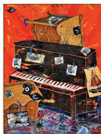
◆展覽同名作品《海之憶》

術家，及其記憶不斷變化的本質。奧特羅說道：「這些巨浪的概念是隱喻性的，它們不是某種景觀地貌，而是獨特的事物，代表着洗盡、捲走、帶來，以及變化。它們是情感的波瀾，也是自然的海浪。」在這些波浪中，奧特羅嵌入了椅子、床和鏡子等物件，它們通常代表着藝術家的家人。奧特羅在作品裏賦予日常物件以超現實的屬性——遊走於姿態與隱喻、記錄與回憶之間，像是行走在夢境中。展覽中亦有一系列抽象新作，如《加勒比交響樂》