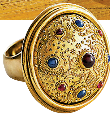
◆ Daniel Brush 以珠化技巧創作的戒指。