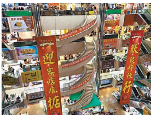
◆羅湖商業城內部裝飾風格很別致。作者供圖

從2008年起，在經歷政府持續多年的高壓打假後，羅湖商業城開始了艱難的轉型過程。但由於產權高度分散，業主多達1,300多個（迄今還有680多個），近九成是香港人或者香港公司，眾口難調，很難對商城進行整體規劃和統一管理，轉型起來障礙重重。與此同時，香港水貨客開始氾濫，與內地的矛盾趨於激化，政治風波此起彼伏，從多方面對羅湖商業城的經營造成衝擊。不過，大多數業主在香港打拚多年，閱盡沉浮，還是相信困難只是暫時的「熊市」，反彈有期，畢竟這裏的口岸樞紐商業地位是無可替代的。生意雖然時好時壞，仍