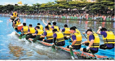
嘩，咁多人嚟睇扒龍船，好心你就唔好拖埋條爛仔嚟睇喇，人邊人跟住就人跟人，你唔怕嗰人跟死你嘅？唔係你死夾死喇！