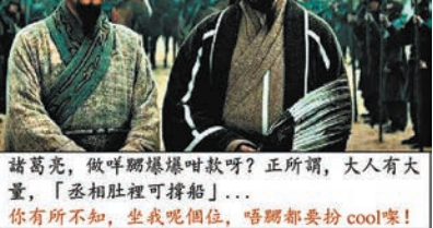
諸葛亮，做咩嚟嗰邊嗰歌呀？王所謂，大人有大量，「丞相肚裡可撐船」... 你有所不知，坐我個位，唔頸都要扮cool喇！