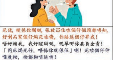
死佬，俾你攞個爛仔，張破仔住個個個頭都唔知，好喇而家個個個頭死咗嘞，你睇返個行界我！唔好攞我，我好醒喇呢，呢單野你要負責！「同床焗死仔，唔係你就係我」喇！死咗個仔仲唔度拋，拋都拋唔返喇！