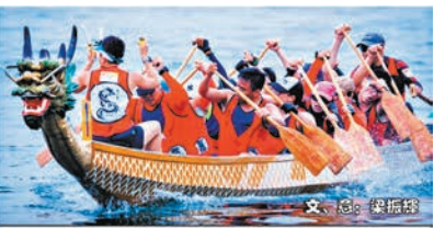
有人睇到我哋扒龍船嘅！吓，成個人岸上上面睇住，你都話有！想人睇嘢到，半夜先出嚟扒喇！有人睇到啱，但係有鬼睇到，哈哈...