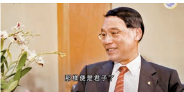
◆香港浸會大學榮休校長陳新滋教授認為，讀好《論語》對人生幫助很大。

自幼熟讀《論語》的香港浸會大學榮休校長陳新滋教授跟我們分享了《論語》一些經典名句：「我想起周恩來。他是一位莊重的君子，使我想起《論語》有一句『君子不重，則不威；學則不固。主忠信，無友不如己者。過，則勿憚改。』我們必須要莊重，無論是言談、禮貌都需要莊重，表達出來都是不怒而威的，周恩來便是這樣。」 「學則不固」，很多人以為是指學習不夠穩固，其實另一說法也許較合理，就是多學習，人便不會頑固，不會固步自封。 「主忠信」，很多人以為是指忠君，其實「忠」是可以指忠於國家。朱熹對孔子思想的解說是「夫子之道，忠恕而已矣。」盡己之謂忠，推己及人之謂恕，盡自己力量做到最好己是忠的了。 「無友不如己者」別誤解以為是與不如己的人做朋友，「不如」的意思是指不與自己志不同道不合的人做朋友，要與志同道合的人一起為共同理想努力，這樣力量便會大。 「過，則勿憚改」是指一個人犯了錯是不要緊的，承認錯誤，然後改好它，那樣便是君子了。 聽陳教授娓娓道來，不難發覺他身上亦傳承着周恩來那一代「讀書人」一派謙謙君子的儒雅風範，舉止莊重，不怒而威，忠於國家，推己及人。 一生致力追求創新科研的世界著名有機化學家陳教授認為，在現今二十一世紀的社會，《論語》不但沒有古舊過時，更為我們帶來深刻的啟示。《論語》有20篇，內容涵蓋很多方面，是孔子多年與學生對話的摘錄，是最精彩的。經過兩千多年，流傳到今天，已經是經典了，能幫助我們思考人生的哲理。所以他認為每個人都應該讀《論語》。 朱熹當時把學、庸、論、孟即4本重要經典列為「四書」，陳教授認為我們現在也要一樣——學、庸、論、孟，人人都應該要讀。《論語》特別容易讀，因為內裏的語句都是很短的，如果大家能夠深刻地讀、清楚地讀，對人生的幫助會很大。