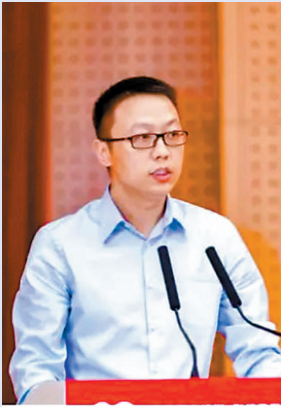
吳泳銘出任阿里巴巴控股集團CEO，同時兼任淘天集團董事長。