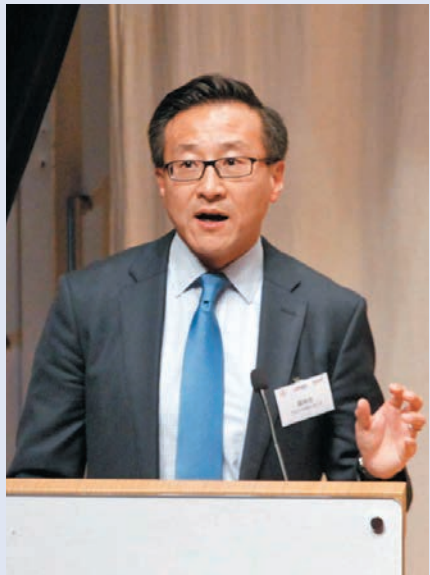
蔡崇信將出任阿里巴巴控股集團董事會主席。