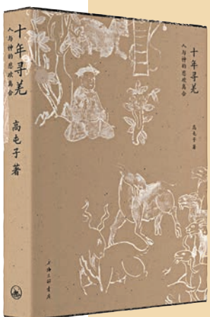
◆圖書《十年尋羌：人與神的悲歡離合》