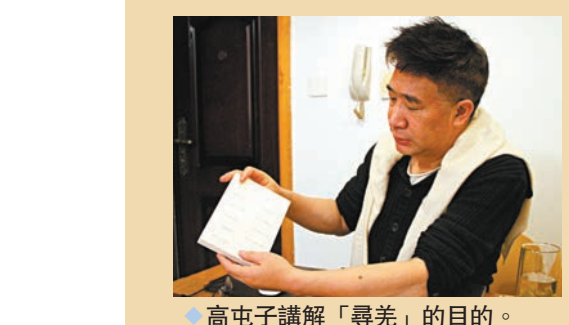
◆高屯子講解「尋羌」的目的。