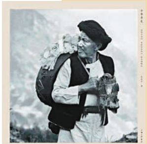
◆攝影集《十年尋羌：遷徙與回歸、羌在深谷高山、最後的釋比》