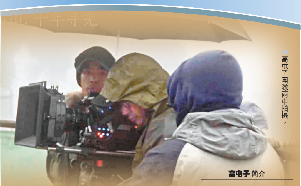
◆高屯子團隊雨中拍攝。