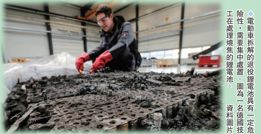
◆電動車拆解的退役鋰電池具有一定危險性，需要集中處置。圖為一名德國技工在處理燒焦的鋰電池。資料圖片