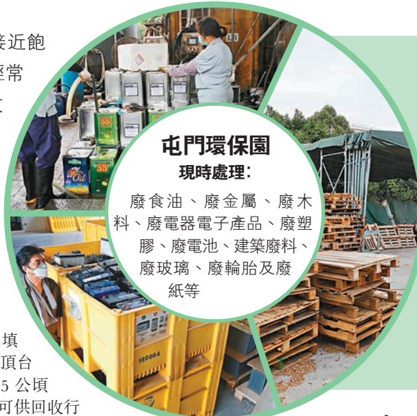
屯門環保園現時處理：

他指出，不當拆卸鋰電池會有爆炸風險，若能在環保園內一條龍處理，既環保又安全，「環保園內現在已有回收廠可處理廢鐵、廢車胎及廢電器，若加上鋰電池回收中心及中央拆解場，電動車便可以完完全全在園內處理，無須將鋰電池出口及運來運去，減低風險。」