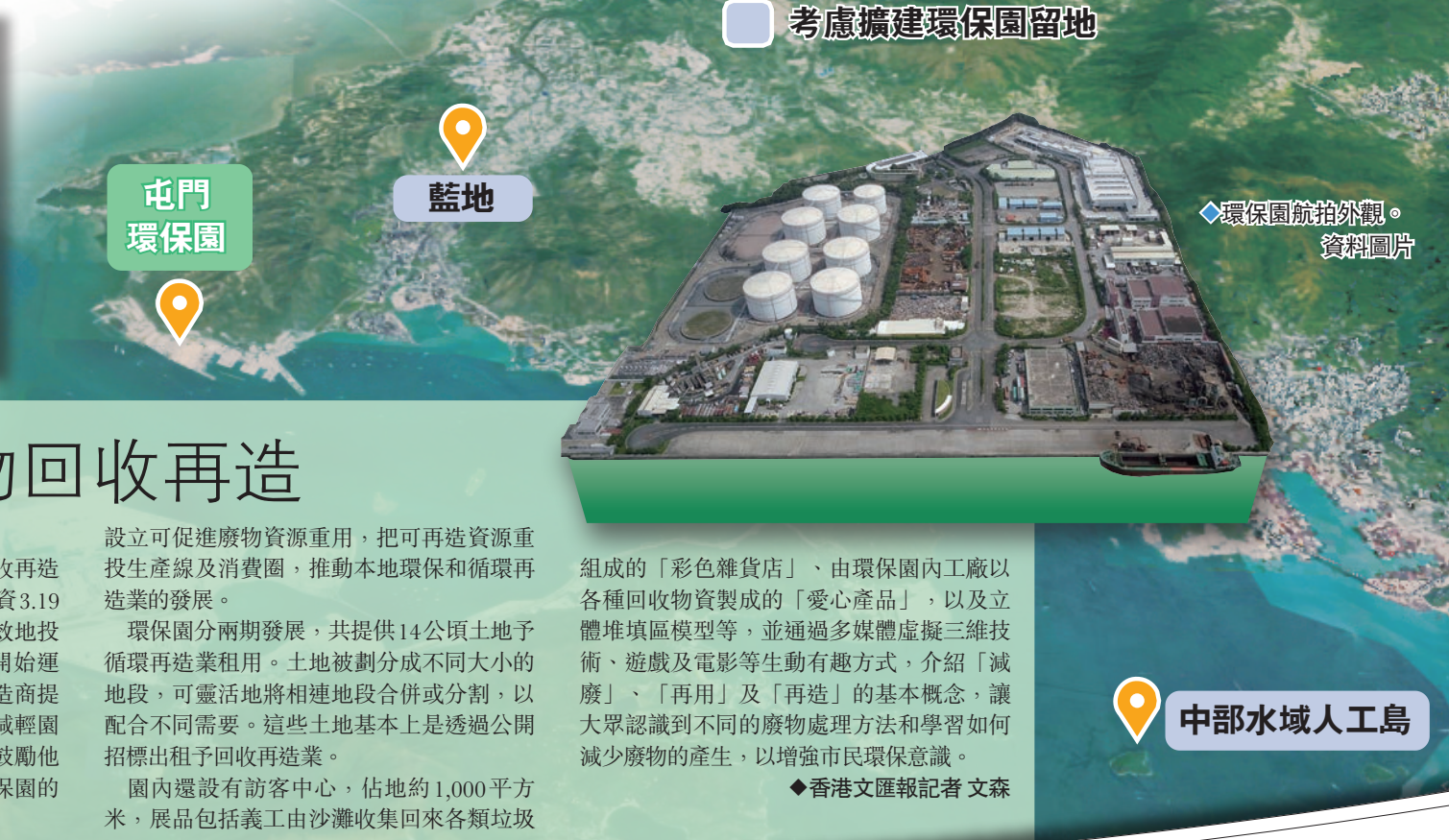
考慮擴建環保園留地