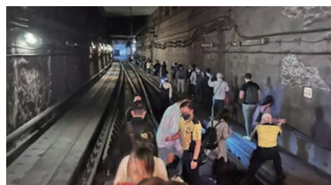
▲去年12月，港鐵將軍澳線發生嚴重事故，乘客由緊急車門離開。資料圖片

除港鐵委任專家小組的檢討報告外，獨立監督小組亦已就去年發生的該兩宗港鐵事故向政府提交報告。獨立監督小組提出13項建議，包括將維修保養工作升級轉型至以科技主導、加強識別及緩解罕見但可導致嚴重後果的風險、成立專責維修保養品質保證團隊，以及投放更多資源保養及更新資產等。綜合兩份報告，港鐵的整體