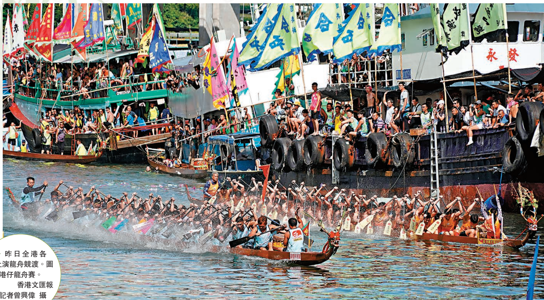
◆昨日全港各區上演龍舟競渡。圖為香港仔龍舟賽。

昨日是端午節，震耳欲聾的擊鼓聲再次在全港各區泳灘及河上響起，標誌闊別香港四年的龍舟競渡復常。不論是觀眾，抑或划艇手也對今次復辦比賽期待已久，哪怕烈日曬得渾身熾熱，喝采聲叫破喉嚨，各參與者盡情享受其中。其中，赤柱正灘上演的赤柱國際龍舟錦標賽氣氛最濃，共168支來自香港及海外的隊伍、約5,000名選手參與，有參賽隊伍更以「紅桃皇后大勝瘟疫大魔王」為題，全隊打扮成國王、皇后與士兵，寓意香港終戰勝新冠疫情，同時亦呼應端午節驅除瘟疫的傳統。有首次參賽的年輕健兒分享，新冠疫情爆發之初正隻身在英國讀書，過去幾年疫情下的社交距離限制亦令外向的她感到十分鬱悶，如今兩週天青期望香港明天繼續更好。