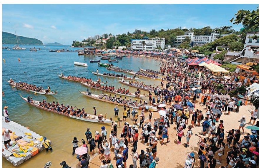
◆大批健兒、市民齊集赤柱正灘一同歡度端午節假期。

市民望穿秋水，極富中國節日色彩的龍舟競渡活動疫後復常重辦，不論本港居民、內地旅客抑或老外，都樂在其中。昨日各區的河道或泳灘擠滿觀賽的市民，龍舟隊健兒更是提前一個月加操備戰。其中，大埔海濱公園今年有56隊報名參加，參賽者多達1,600人，全日有18場賽事，8,000名觀眾；沙田城門河兩邊亦擠滿觀賽的市民。