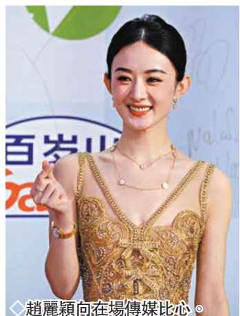
趙麗穎向在場傳媒比心。