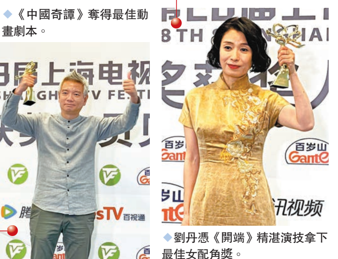
《中國奇譚》奪得最佳動畫劇本。