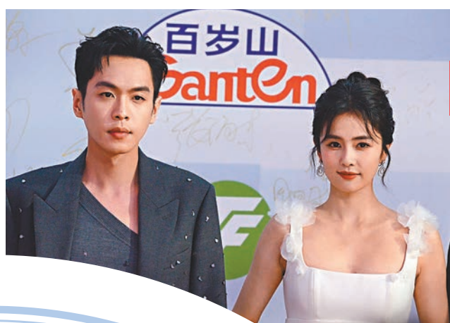
秦嵐穿中空連衣裙登紅毯超吸睛。