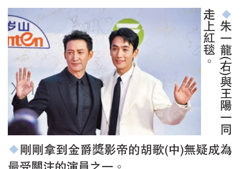
剛剛拿到金爵獎影帝的胡歌(中)無疑成為最受關注的演員之一。