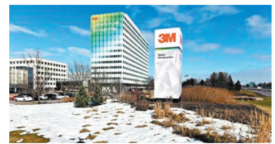
◆3M位於美國明尼蘇達州的全球總部。

3M在開庭前與多個公共供水供應系統達成和解協議，將於未來13年向不同城市的供水系統提供資金，檢測「永久化學品」和過濾食水。原告律師表示，今次與3M達成美國史上最大型的食水和解協議，可令數以千萬計美國人飲用安全食水。