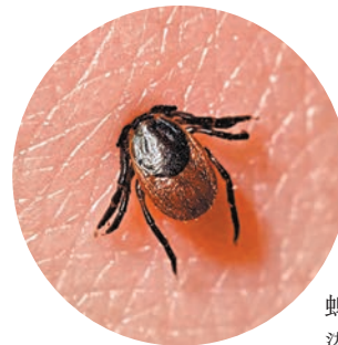
香港文匯報訊 日本茨城縣昨日公布，當地一名70多歲女子被蜱蟲咬到後，感染一種人畜共通的 Oz 病毒，在入院26日後因心肌梗死死亡，成為全球首例。

茨城縣公布一名在該縣居住的老婦去年夏季因出現發燒、疲勞及嘔吐的症狀，到縣內醫療機構求診。當時醫生懷疑她感染肺炎，向她開出抗生素等