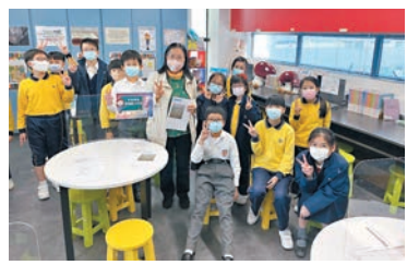
◆筆者參加的學生們！

我希望這樣有意思的廣播劇工作坊，可持續推廣到港九新界更多校園，讓更多青少年體會領悟到廣播劇的樂趣及深義。