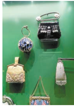
◆「Bag: Inside Out」展覽中設計獨具匠心的手袋。

主角莎拉謝茜嘉柏加(Sarah Jessica Parker)在劇中使用的經典Baguette、由Hermès的傳統工藝到街頭風格。此外，還有手袋製作的草圖和工具等，展品豐富，增長知識。場內更設導賞、工匠工作坊、「Bag the Spotlight」360度影片拍攝裝置。公眾免費入場，展出至7月中，值得欣賞。