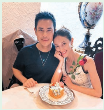
鄭嘉穎為陳凱琳準備浪漫晚餐。梁芷珊9月會到北極拍攝新一輯旅遊節目。