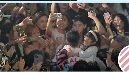
有女粉絲攬實周湯豪。