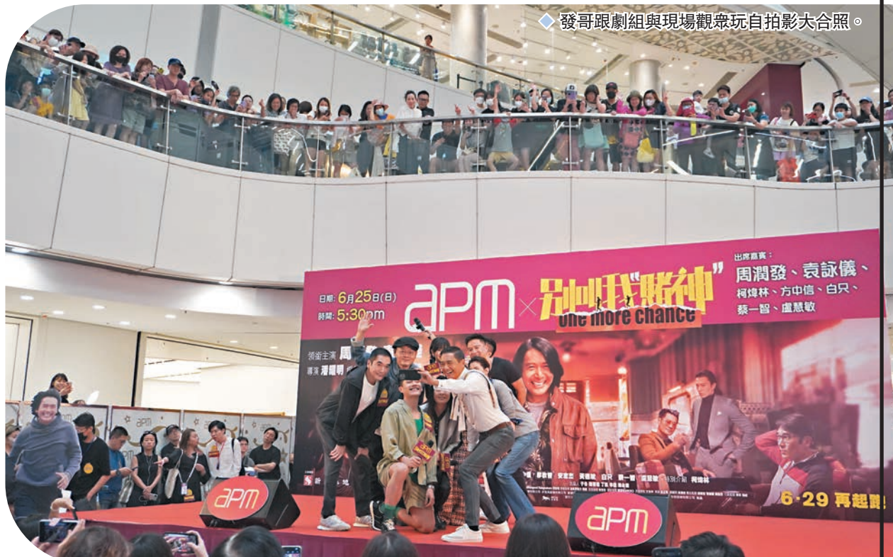
發哥跟劇組與現場觀眾玩自拍影大合照。