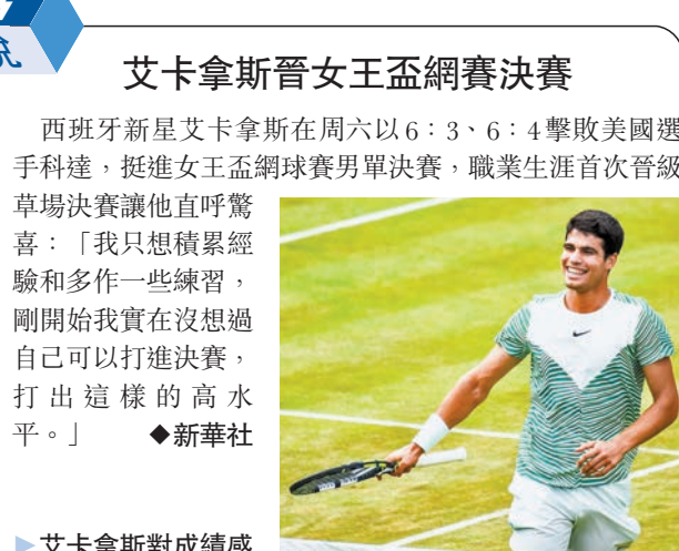
◆艾卡拿斯對成績感意外。