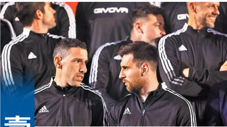
◆美斯出席麥斯洛迪古斯(左)告別賽。

一段時間未有回成長之地羅沙里奧過生日，今年的生日對他來說別具意義：「我已經有很長時間沒有回到羅沙里奧和家人朋友過生日，這是我成為世界盃冠軍後的第一個生日，所以特別有意義，每次回到羅沙里奧都有特別的感覺。」雖然將人人的告別戰變成了自己的生日派對，不過向來謙遜的美斯仍不忘提到阿根廷歷代國腳的貢獻：「正如我之前所說，輪到我們成為世界冠軍了，但在我們身後有很多令人印象深刻的球員，他們為國家隊做了很多偉大的事情，只是沒有舉起獎盃。」而對於自己未來的足球生涯，美斯則表示會繼續好好享受足球：「贏得世界盃是特別和獨特的經歷，亦是每個球員的夢想，但你考慮的是未來，而不是做了什麼。當輪到我離開足球時，我將記住並享受所取得的一切。」