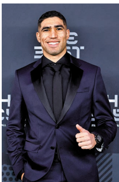
◆阿舒拉夫獲得曼城青睞。資料圖片

另一方面，近日買賣頻繁的車路士，在當地時間周六傳出陣中老臣子艾斯派古達提前解約。現年33歲的艾斯派古達在2012年由馬賽加盟車路士，一直是球隊後防主力，但在年漸漸下，這位西班牙國腳近期已失去正選，故會方亦同意提早一年和這位老臣子解約。消息指，艾斯派古達並不會返回西班牙聯賽效力，相反將可以以自由身加盟國際米蘭。