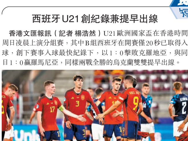
◆西班牙U21可提早出線。美聯社