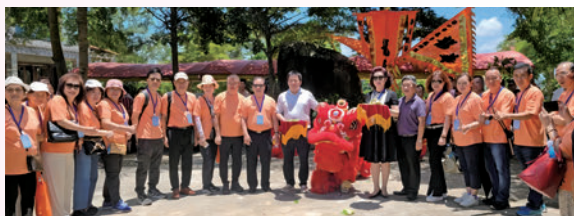
◆團員們在文教鎮的文星水岸，欣賞歡樂的舞獅表演。