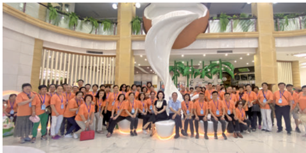
◆團員們在春光食品有限公司參訪。