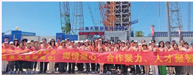
◆團員們參觀航天規劃設計集團，展望家鄉發展前景。

在為期一周的深度探訪中，團員們見證了海南自貿港和文昌國際航天城的成長與轉變。這兩個項目不僅象徵海南省在開放創新之路上取得的重大成就，更彰顯了文昌市在推動本地發展和在國家改革開放中所作出的重要貢獻。文昌國際航天城，則象徵著科技與夢想的結晶。這座城市是中國首個以航天科技為主題的綜合性國際旅遊城市，將太空探索的壯麗與神秘完美融合。天際線上的火箭，高科技的展示館，讓團員們充滿對探索未來的期待。海南自貿港和文昌國際航天城，就如同兩顆璀璨的明珠，照亮了海南乃至中國的未來。