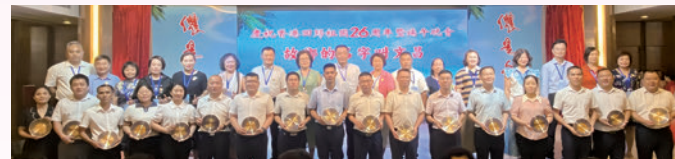
◆香港文昌社團聯會17個鎮同鄉會與文昌市17個鎮政府深度融合，分別給17個鎮政府贈送紀念品，以表達聯會對他們長期以來支持關心的感謝。

同為海南的發展出力，以實現海南更大的繁榮與發展。同仁堅信，只要攜手共進，就一定能夠為海南的未來創造出更加輝煌的篇章，為實現中華民族偉大復興作出更大的貢獻。在這個過程中，聯會將把香港鄉親與海南人民的情感紐帶繼續維護和深化，把香港的經驗與智慧與海南的資源與潛力進行結合，共同開創一個充滿活力、具有遠見、和諧共享的新時代。