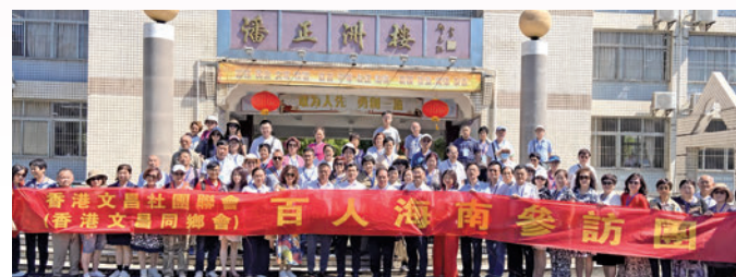
◆團員們參觀文昌中學，希望每一位孩子都能在這裡收穫知識，成為社會的建設者和未來的引領者。