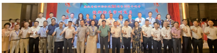
◆海南這座充滿活力和希望的自貿港，正在用它的開放和繁榮，吸引全世界的目光。聯會對此充滿了期待和信心，希望以此次參訪為契機，攜手共進，共創美好未來。

香港文昌社團聯會17個鎮同鄉會與文昌市17個鎮政府深度融合，分別給17個鎮政府贈送紀念品，以表達聯會對他們長期以來支持關心的感謝。對於未來，聯會同仁期待與海南人民進行更深入的交流與合作，共