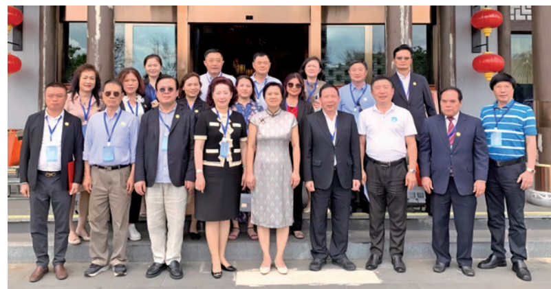
◆香港文昌社團聯會（香港文昌同鄉會）與省僑聯共謀合作，加深瓊港聯繫。