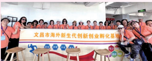
◆團員們步入海外新生代創業創新孵化基地，親身感受最新的創業創新風潮。