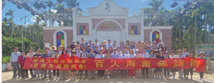
◆團員們在海南斑蘭文創第一村合影。

當團員深入接觸海南的民俗風情和歷史文化時，逐一參訪了當地的城市中心、旅遊景點、歷史古蹟，也深入了解創新孵化基地、現代農業、休閒農莊、鄉村建設、企業團體、航天發展、學校圖書館等。他們聆聽豐富的民間故事，被海南人民的熱情、開朗、勤勞與智慧所打動；還品嚐了海南的地道美食，參觀了海南著名景點，包括歷史悠久的古建築、獨特的人文景觀等。活動讓大家更深刻地了解了海南的歷史和文化。