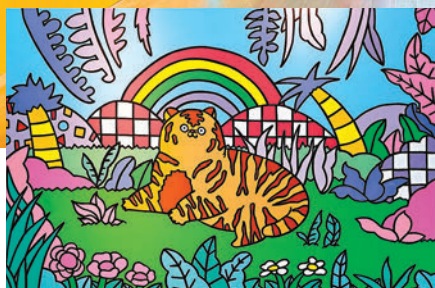
新角色老虎則代表藝術家屬虎的兒子。