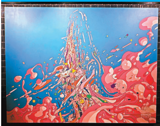
藝術家 Bo 的作品《Life is about relationships》。