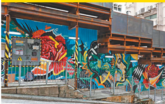
藝術家 Taka 的作品《Ndi》。

導賞路線： 聖佛蘭士街5號 St. Francis Street Hoarding (QRE) > 聖佛蘭士街5號 St. Francis Street Hoarding > We 嘩藍屋 Viva Blue House > The Vine Church