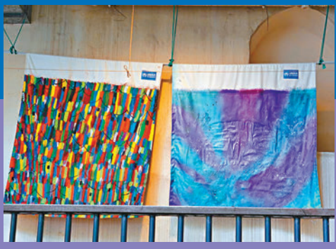
位於藍屋建築群的《Colors of Home》(左) 和《Colors of Sky》。

Erin Hung 是香港藝術家、壁畫家及作家。她以受壓抑及被漠視的聲音作為創作的重心，深信「說故事」是提高社區同理心的不二之選。