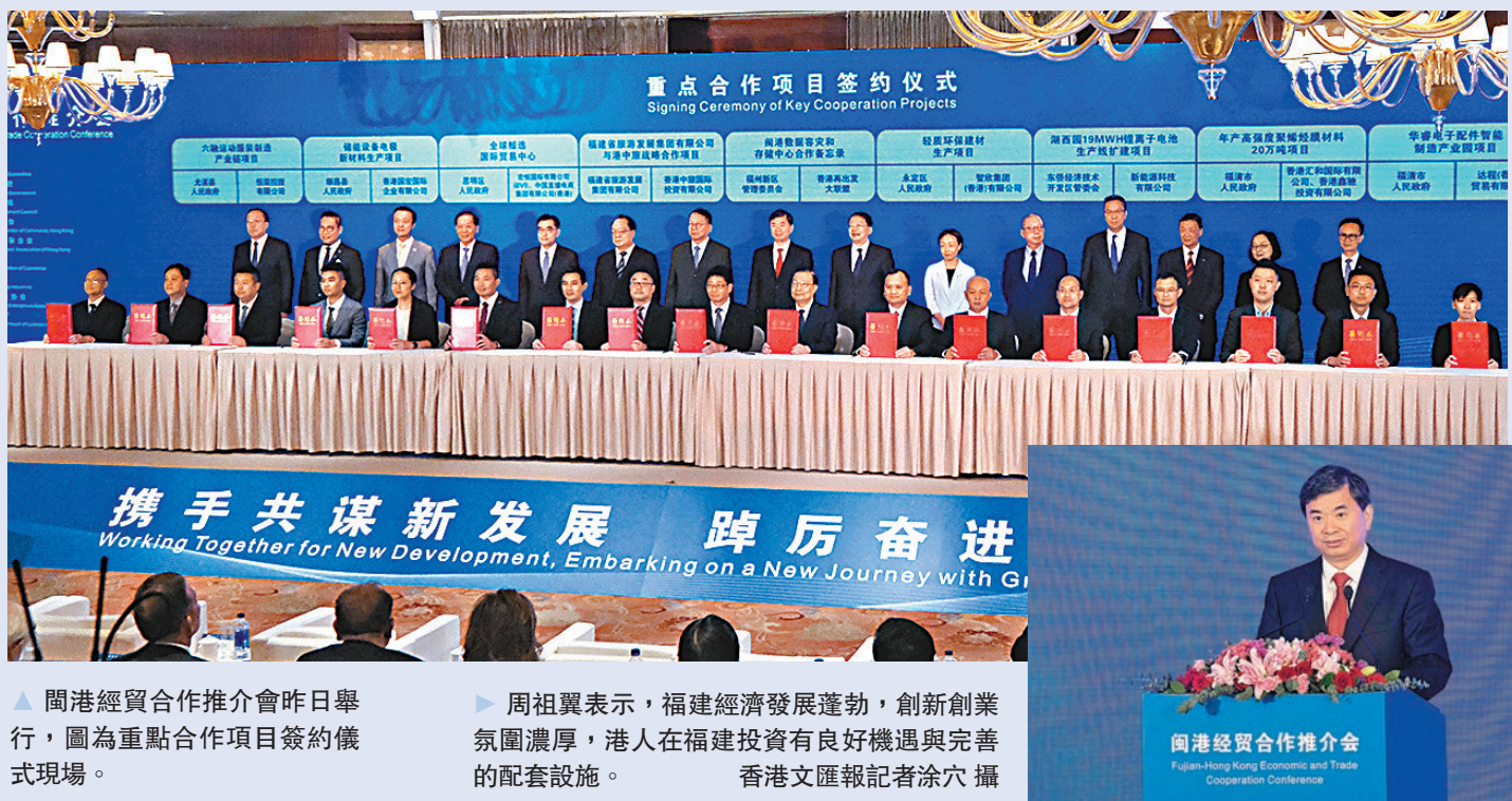
▲閩港經貿合作推介會昨日舉行，圖為重點合作項目簽約儀式現場。